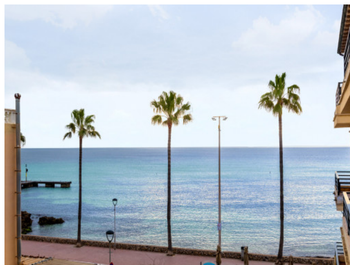
Wenige Schritte bis zum Meer