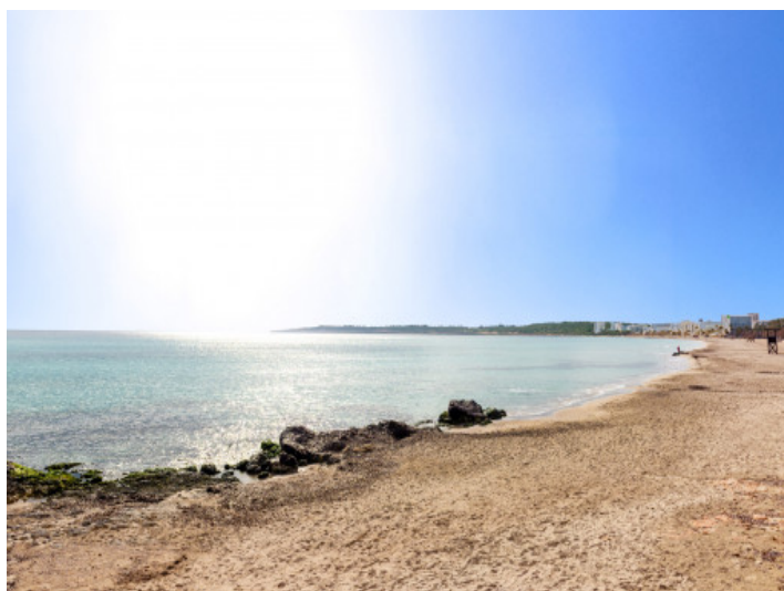
Strand in der Nähe