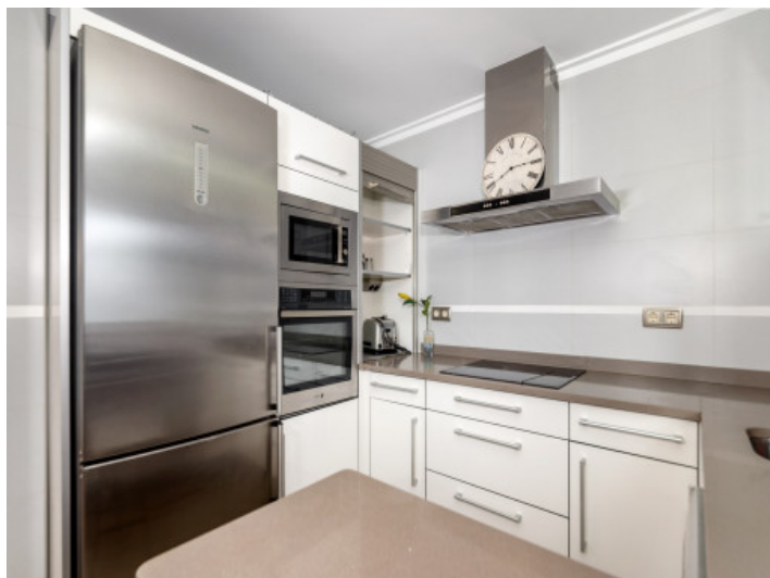
Weitere Ansicht der Küche