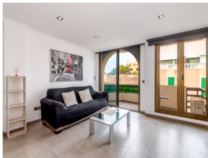
Wohnbereich mit Balkonzugang