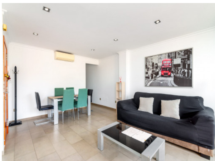
Offen gestalteter Wohn-/Essbereich