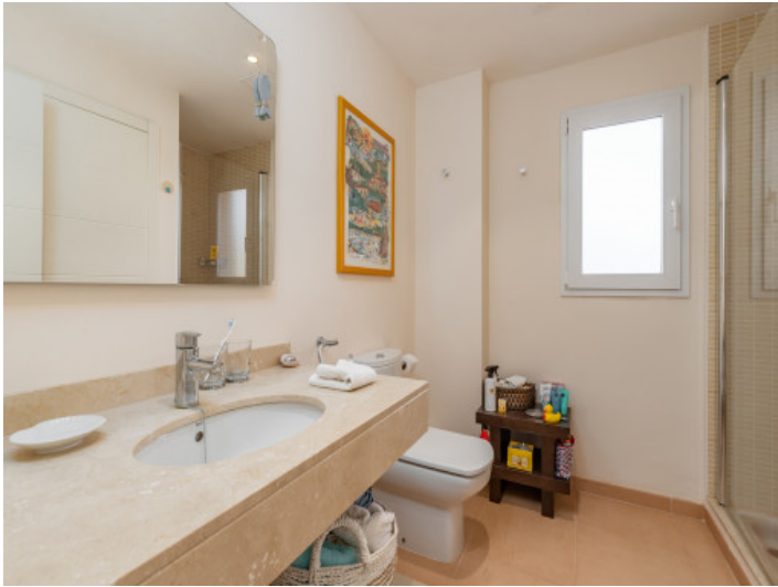
Eines von 2 Badezimmer