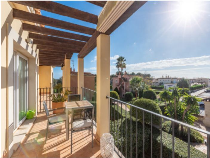
Terrasse mit Weitblick