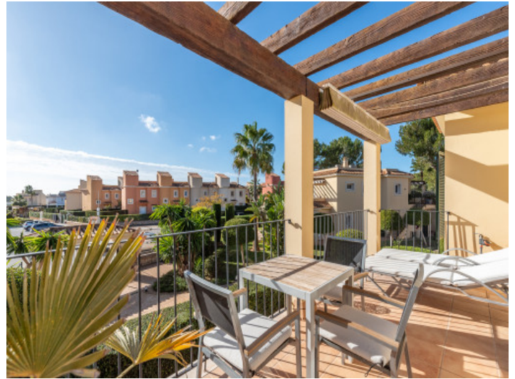
Große Terrasse mit Weitblick