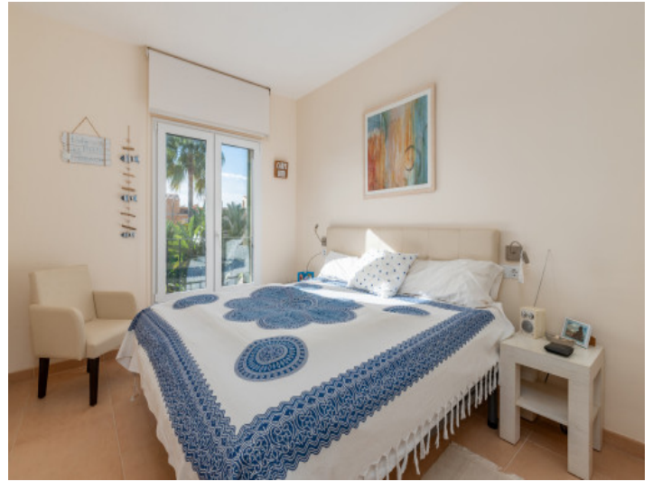
Das 2. Schlafzimmer