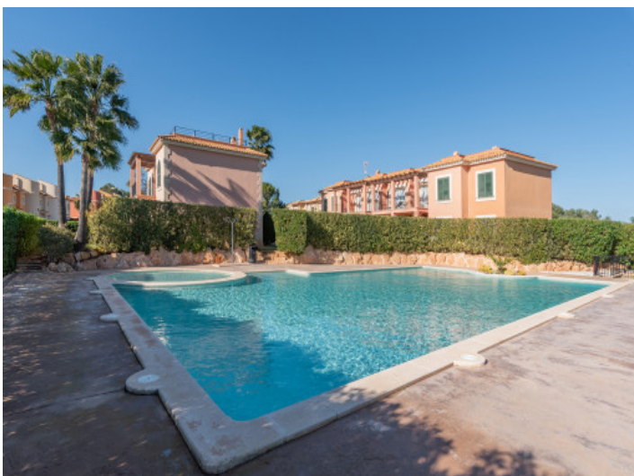
Ansicht auf die Wohnanlage