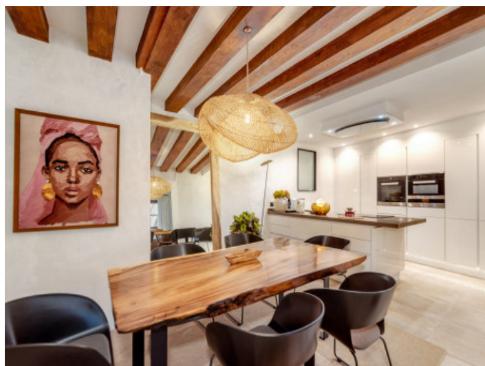
Essbereich und offene Küche