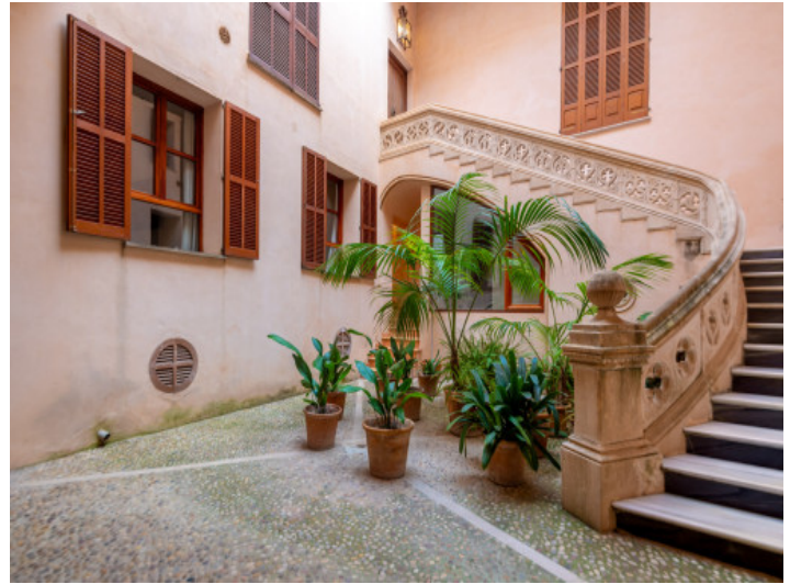
Mallorquinischer Altstadt Patio