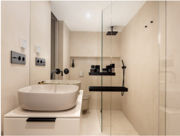
Modernes Badezimmer mit bodentiefer Dusche