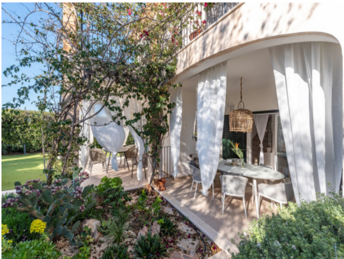
Terrasse und Garten