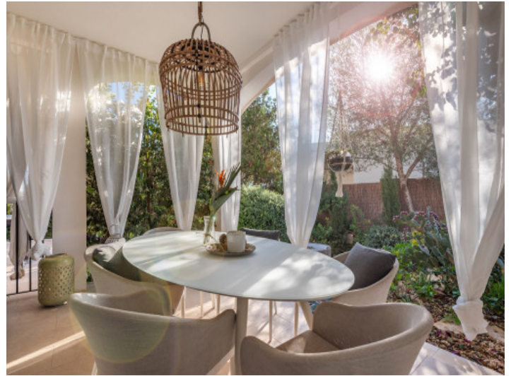
Wunderschöne, überdachte Terrasse