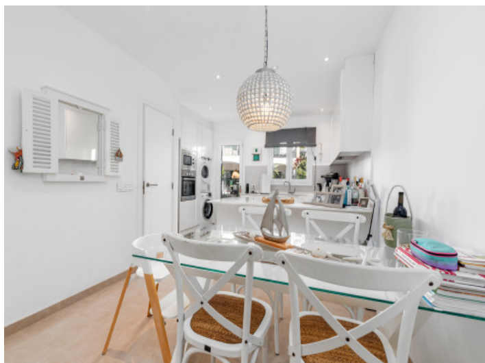
Essbereich mit amerikanischer Küche