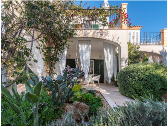
Außenansicht der Duplexwohnung