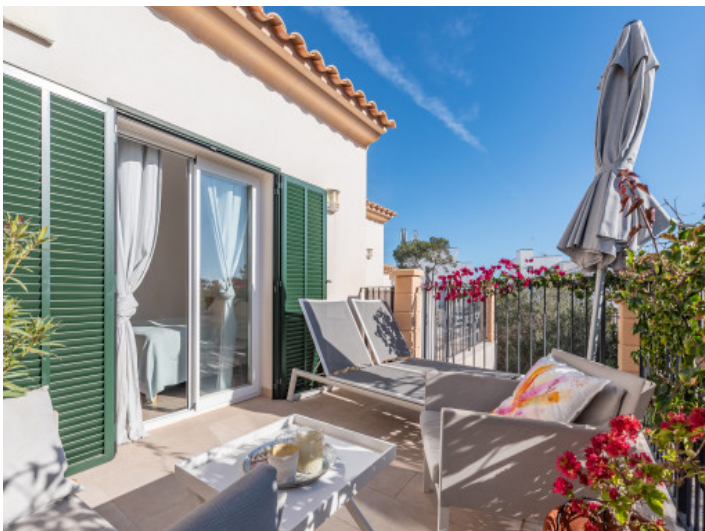
Sonnenterrasse vor einem Schlafzimmer