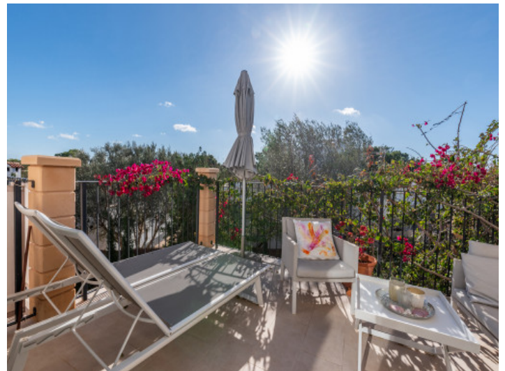
Sonnenterrasse mit Aussicht