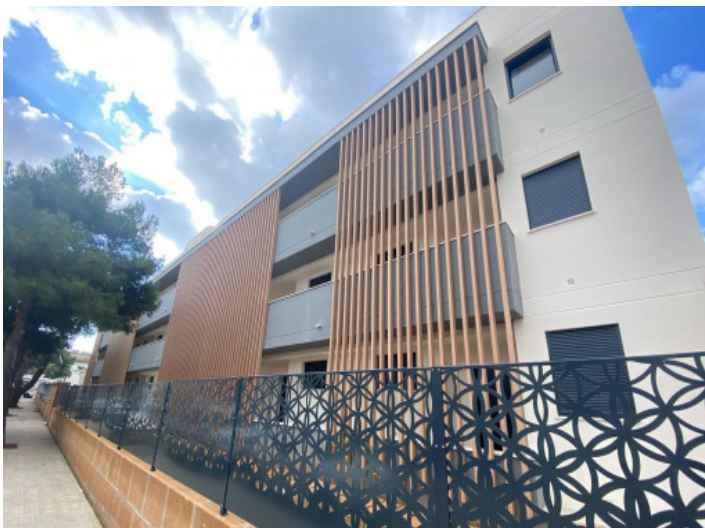
Ansicht auf das Mehrfamilienhaus