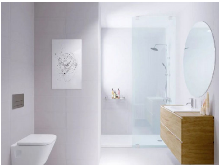
Zwei moderne Badezimmer