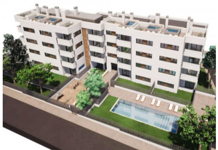
Erdgeschosswohnung mit Garten in Cala Ratjada