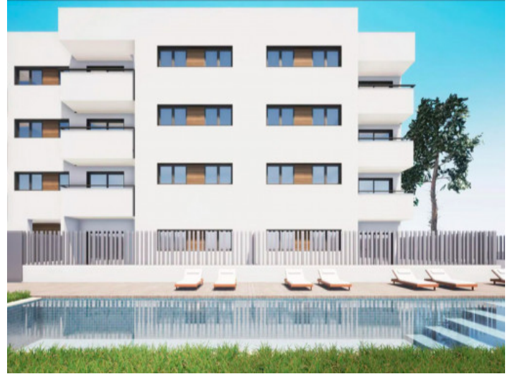
Penthouse mit Pool in Cala Ratjada