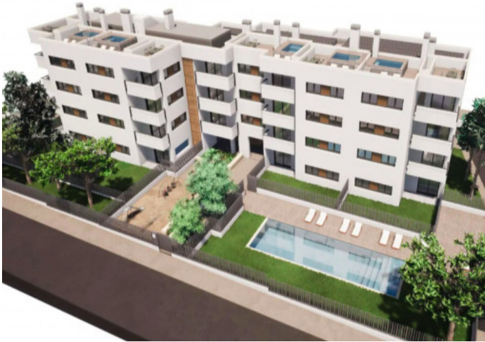
Neue Wohnanlage mit Gemeinschaftspool & Spielplatz in Cala Ratjada -