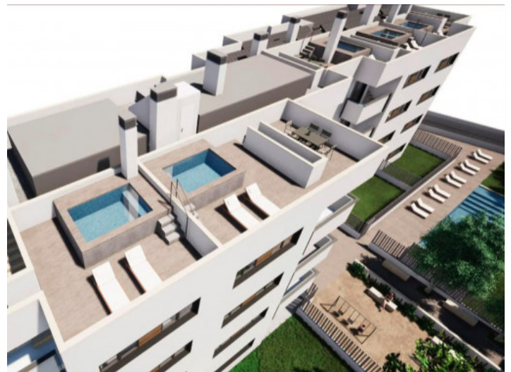
Neue Wohnanlage mit Gemeinschafts-Pool & Spielplatz in Cala Ratjada - Wohnung 1 Stock

Alle Angaben nach bestem Wissen. Irrtum und Zwischenverkauf vorbehalten. Dieses Exposé ist eine Vorinformation, als Rechtsgrundlage gilt der am 01.01.2024 geschlossene Kaufvertrag.