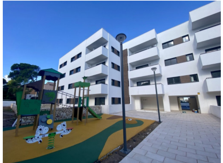
Kinderspielplatz und Fassade