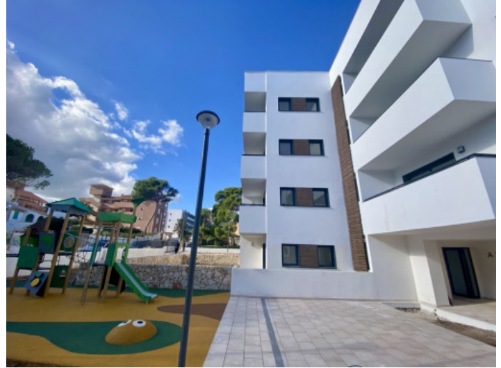
Fertigstellung Januar 2025