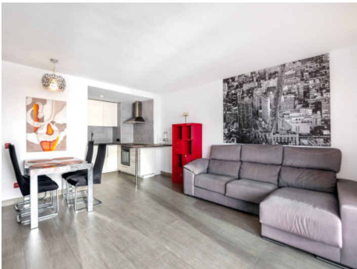
Heller Wohn- und Essbereich