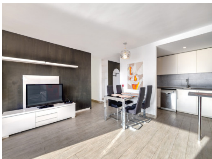
Heller Wohn- und Essbereich