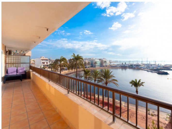
Terrasse mit Meerblick