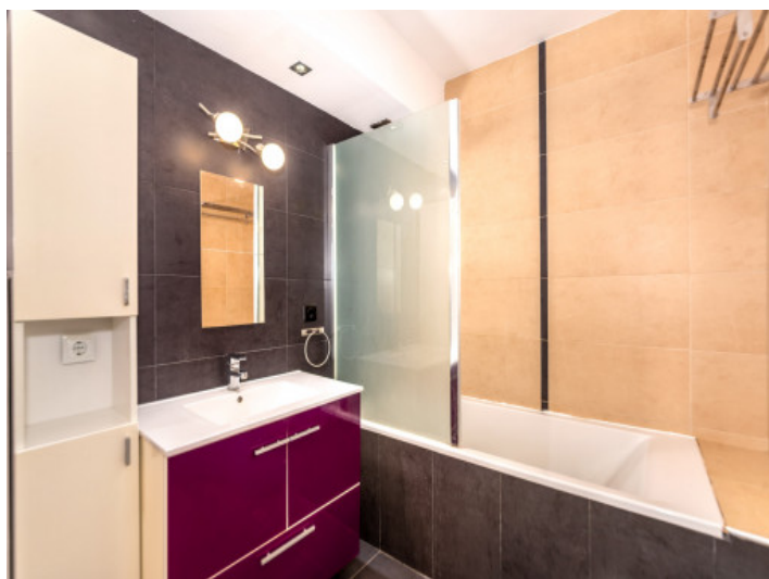
Wohnung mit einem Badezimmer