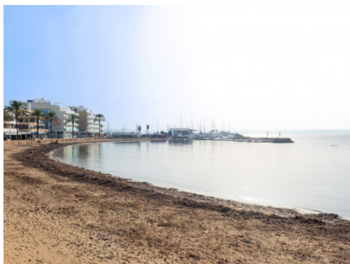
Der Strand liegt vor der Haustür

Alle Angaben nach bestem Wissen. Irrtum und Zwischenverkauf vorbehalten. Dieses Exposé ist eine Vorinformation, als Rechtsgrundlage gilt allein der notariell abgeschlossene Kaufvertrag.