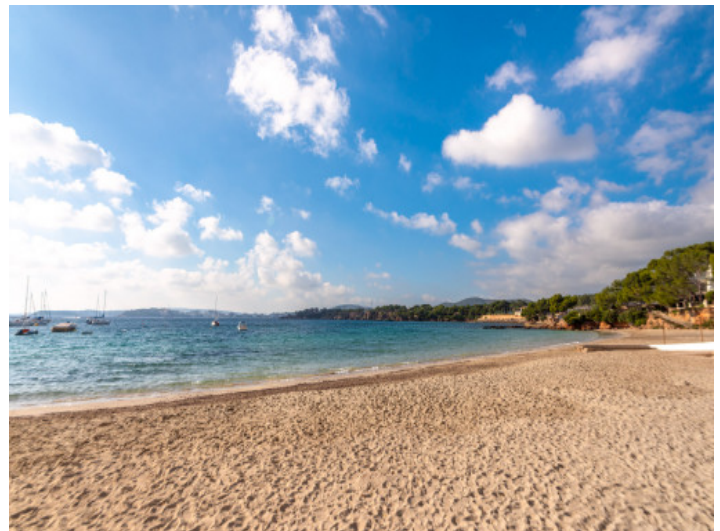
Strand in der Nähe