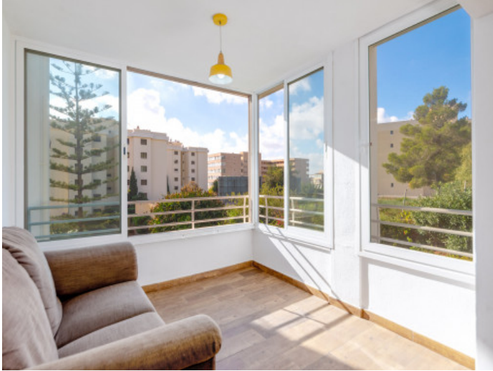
Wohnung in bester Lage in Portals Nous