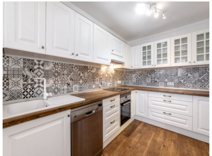
Sehr gepflegte Küche