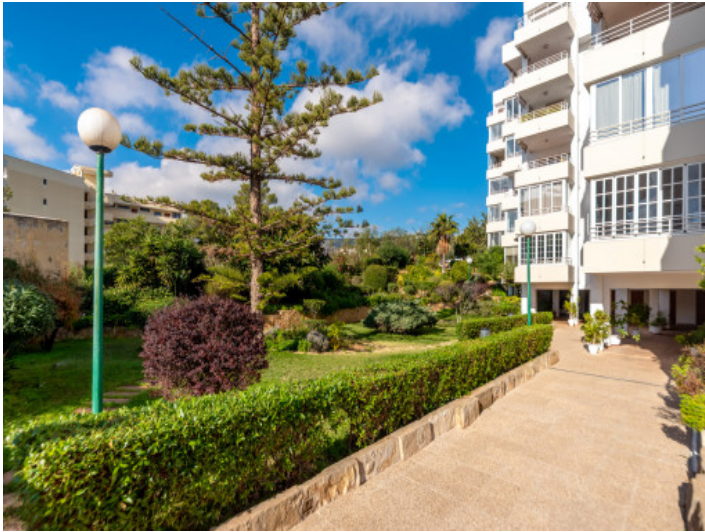
Außenansicht des Gebäudes