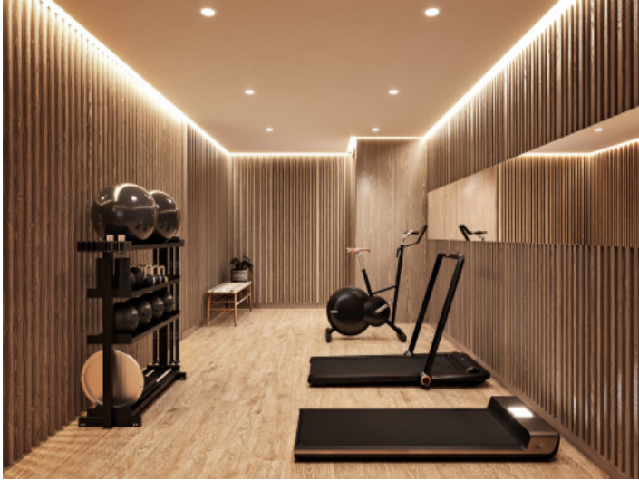
Gemeinschaftsbereich mit Fitnessraum