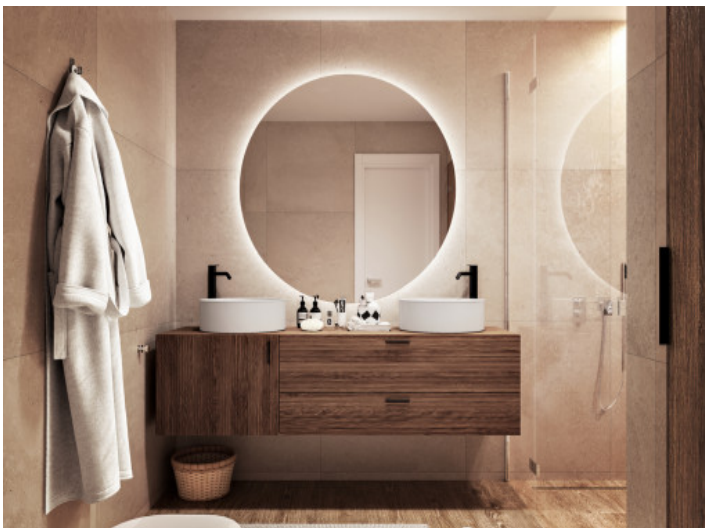
Badezimmer mit bodentiefer Dusche