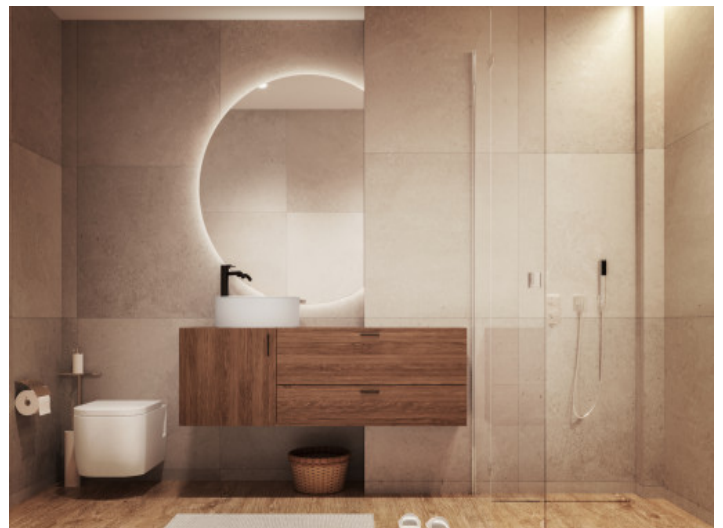
Wohnung mit 2 Badezimmern

Alle Angaben nach bestem Wissen. Irrtum und Zwischenverkauf vorbehalten. Dieses Exposé ist eine Vorinformation, als Rechtsgrundlage gilt allein der notariell abgeschlossene Kaufvertrag.