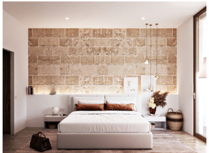
Ein weiteres Schlafzimmer