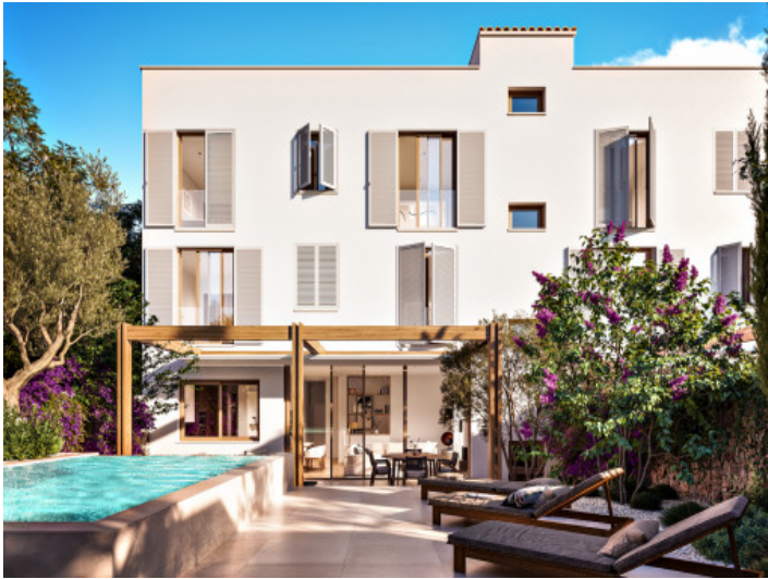
Garten mit privatem Pool