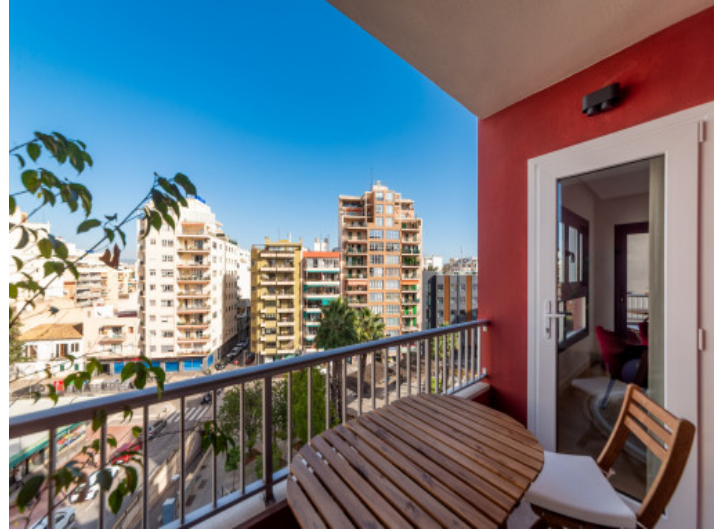
Mit Balkon und im Stadtzentrum