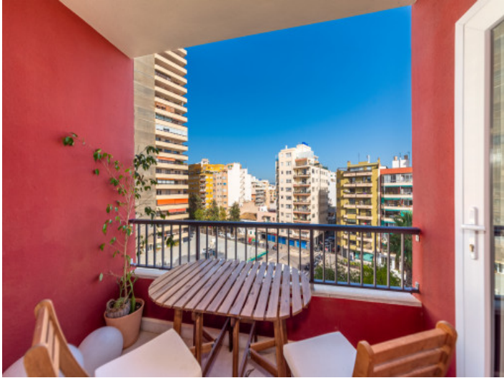
Stadtwohnung mit Balkon