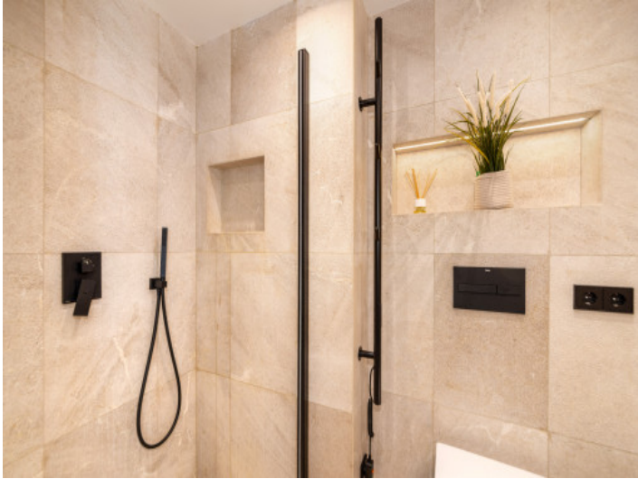
Ein weiteres Badezimmer