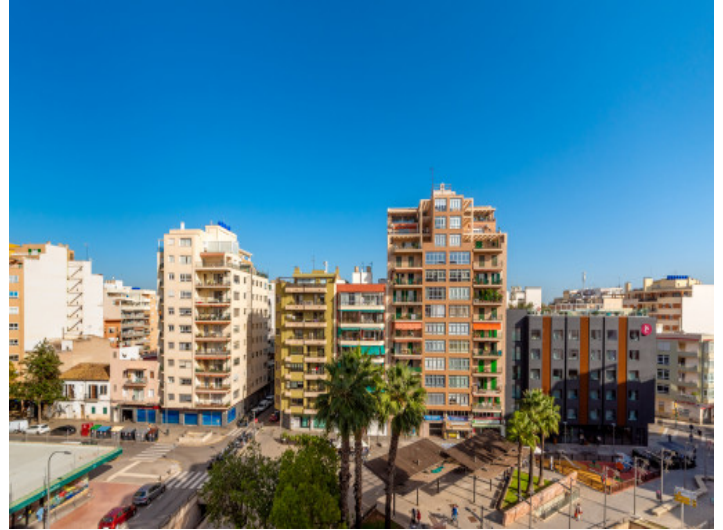
Aussicht auf die Umgebung