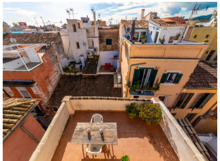
Terrasse aus der Vogelperspektive

Alle Angaben nach bestem Wissen. Irrtum und Zwischenverkauf vorbehalten. Dieses Exposé ist eine Vorinformation, als Rechtsgrundlage gilt allein der notariell abgeschlossene Kaufvertrag.