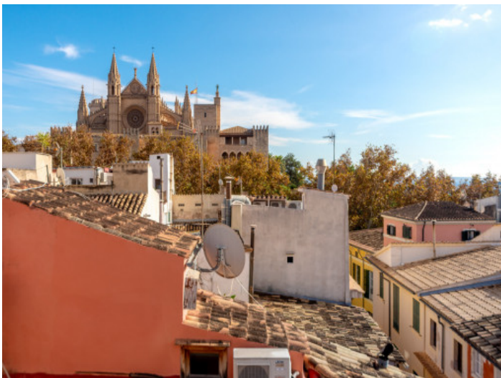
Blick über die Dächer