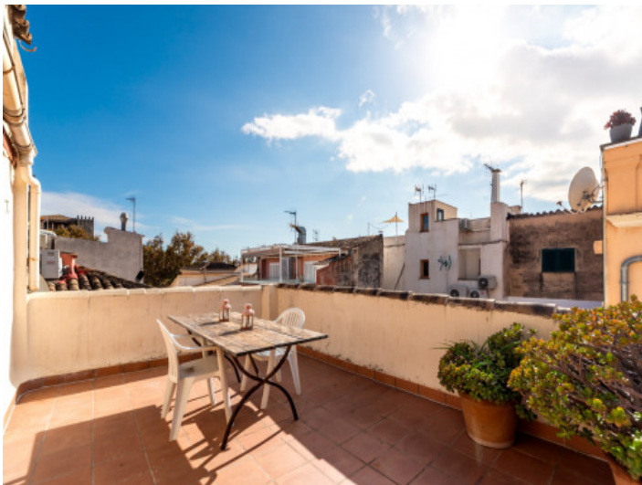
Weitere Ansicht der Sonnenterrasse