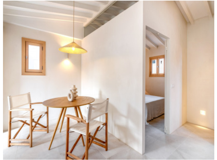
Essbereich und Schlafzimmer