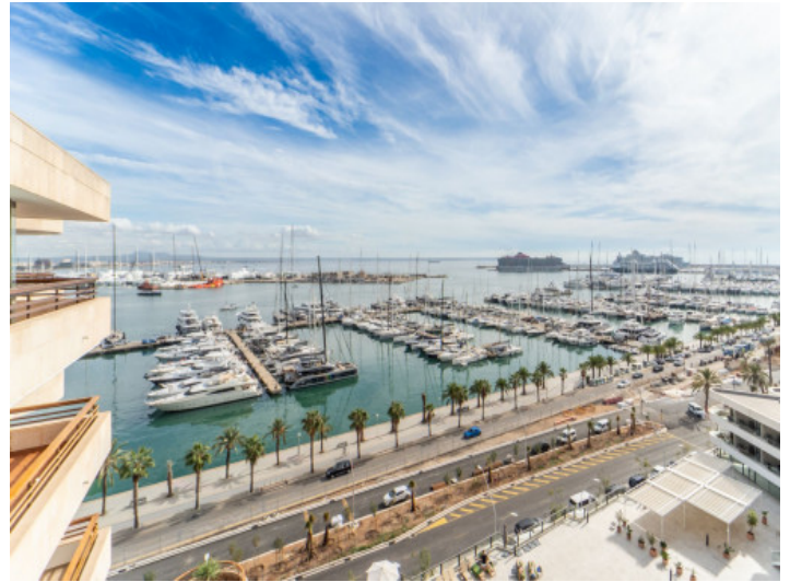
Hafen- und Meerblick