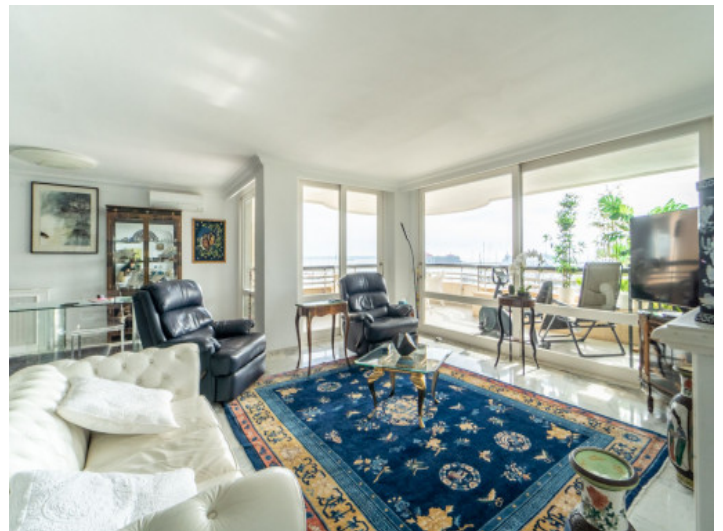
Wohnbereich mit Meerblick