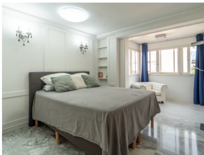
Eines von 5 Schlafzimmern