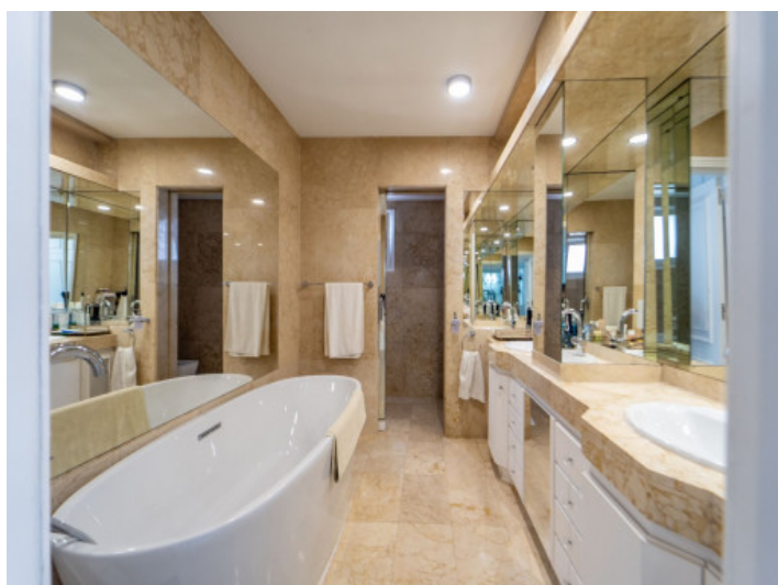
Badezimmer en S'uite