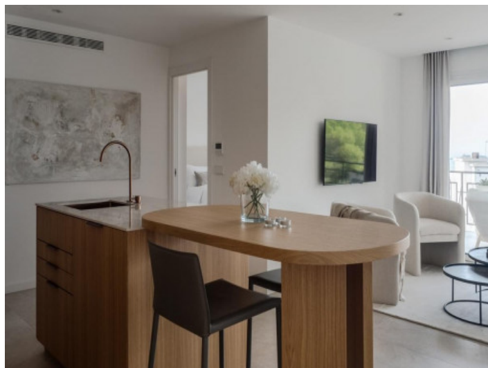
Offener Wohn- Essbereich