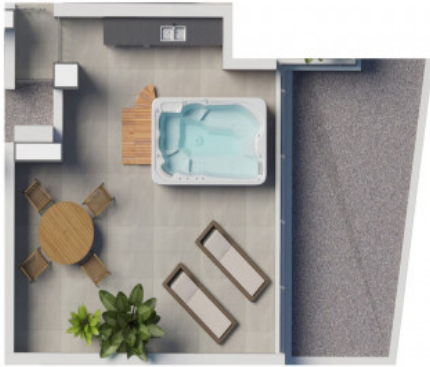
Grundriss der Terrasse