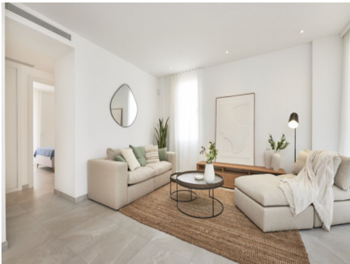
Weitere Ansicht des Wohnbereichs