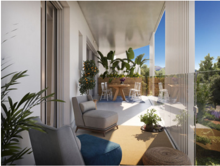
Tolle, überdachte Terrasse