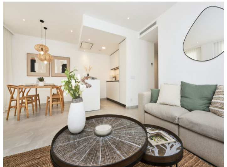
Offen gestalteter Ess- und Küchenbereich