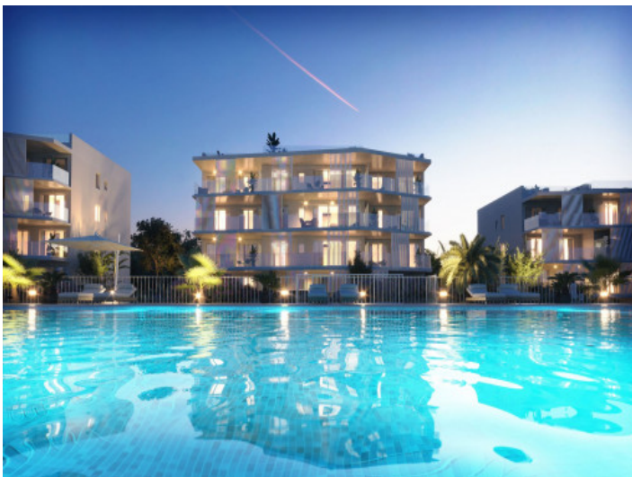
Wohnanlage bei Dämmerung