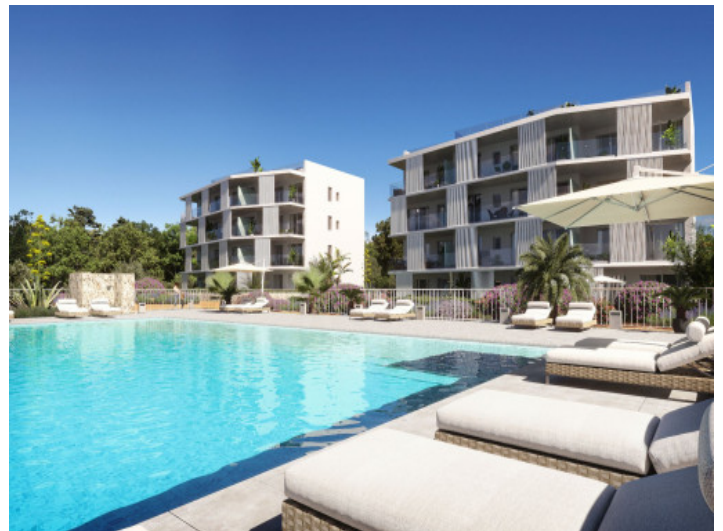
Außenansicht mit Poolbereich