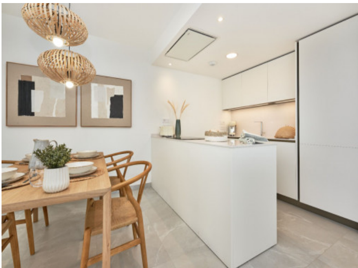
Moderne Küche mit angrenzendem Essbereich