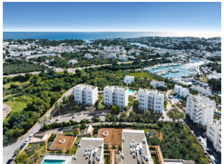
Wohnanlage aus der Vogelperspektive

Alle Angaben nach bestem Wissen. Irrtum und Zwischenverkauf vorbehalten. Dieses Exposé ist eine Vorinformation, als Rechtsgrundlage gilt allein der notariell abgeschlossene Kaufvertrag.