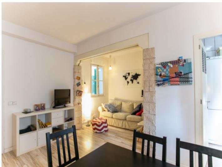
Blick in den gemütlichen Wohnbereich