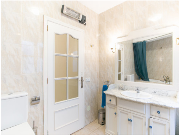
Alternative Ansicht des Badezimmers