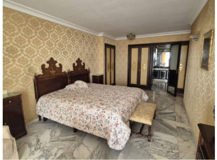
Eines von 4 Doppelschlafzimmern