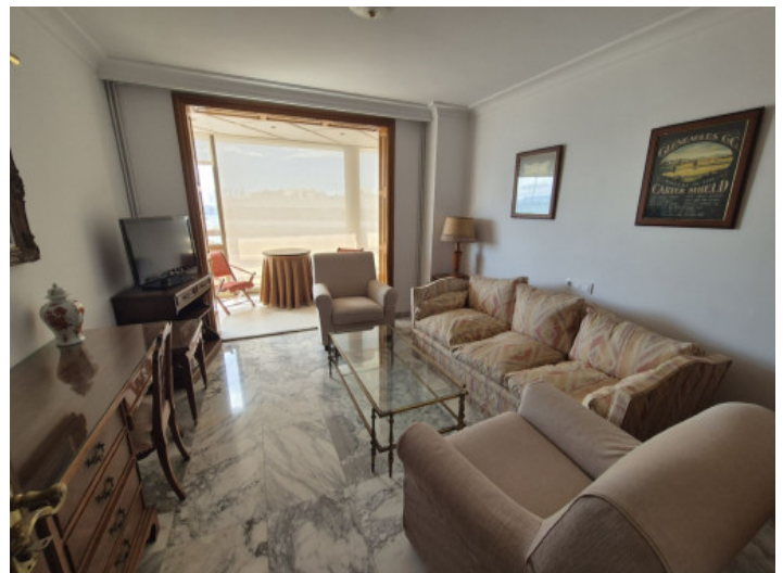
Büro oder Schlafzimmer

Alle Angaben nach bestem Wissen. Irrtum und Zwischenverkauf vorbehalten. Dieses Exposé ist eine Vorinformation, als Rechtsgrundlage gilt allein der notariell abgeschlossene Kaufvertrag.