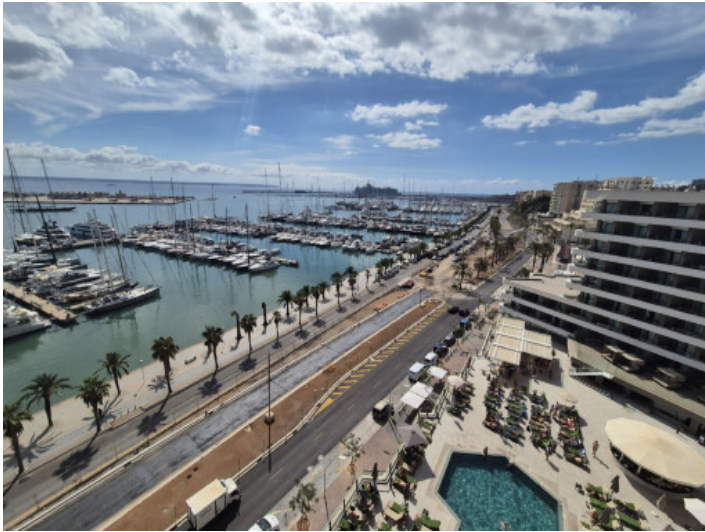
Fantastischer Meer- und Hafengeblick