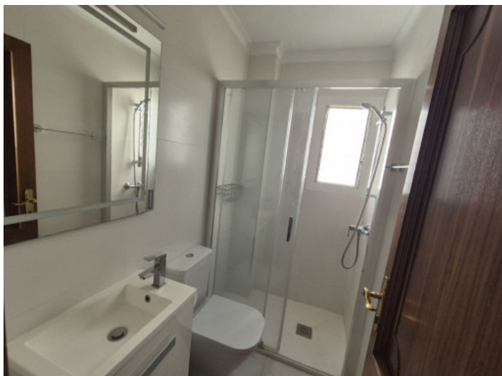
Badezimmer mit bodentiefer Dusche