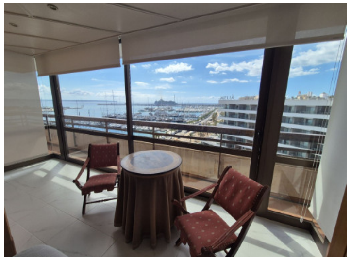
Wohnbereich mit Traumaussicht

Alle Angaben nach bestem Wissen. Irrtum und Zwischenverkauf vorbehalten. Dieses Exposé ist eine Vorinformation, als Rechtsgrundlage gilt allein der notariell abgeschlossene Kaufvertrag.