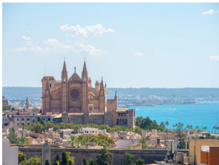
Blick auf die Kathedrale und das Meer

Alle Angaben nach bestem Wissen. Irrtum und Zwischenverkauf vorbehalten. Dieses Exposé ist eine Vorinformation, als Rechtsgrundlage gilt allein der notariell abgeschlossene Kaufvertrag.