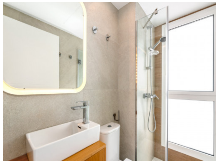
Ein weiteres Badezimmer

Alle Angaben nach bestem Wissen. Irrtum und Zwischenverkauf vorbehalten. Dieses Exposé ist eine Vorinformation, als Rechtsgrundlage gilt allein der notariell abgeschlossene Kaufvertrag.