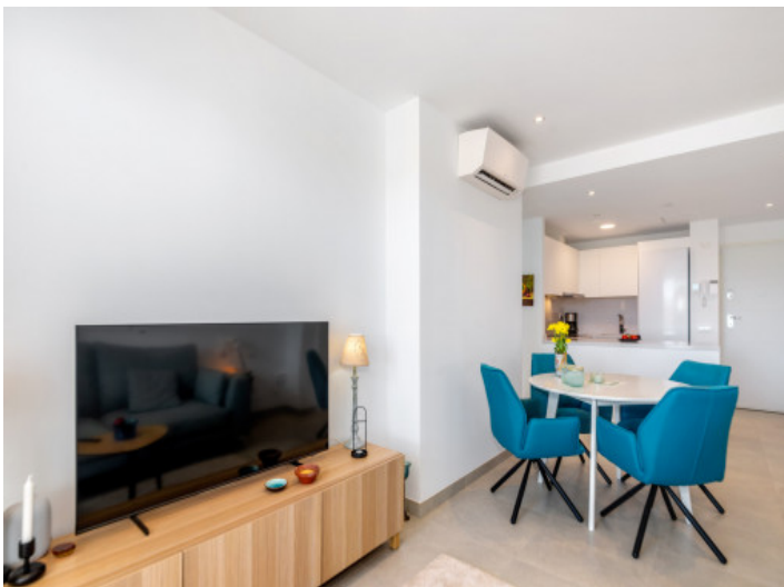
Wohn- und Essbereich