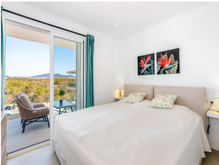
Eines von 2 Schlafzimmern