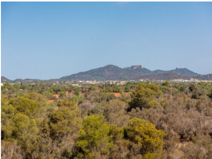
Weitblick bis Sant Salvador