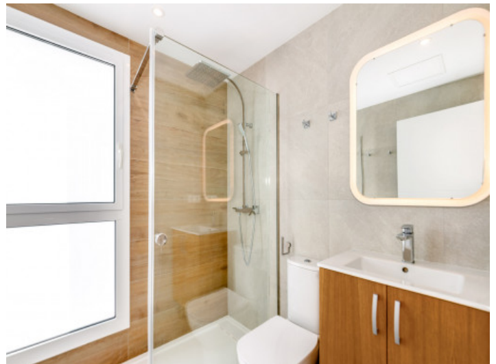
Badezimmer mit bodentiefer Dusche