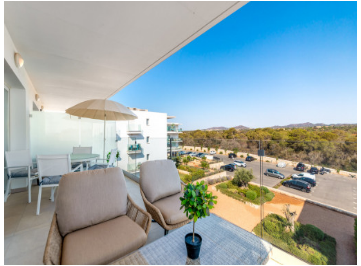
Terrasse mit Weitblick