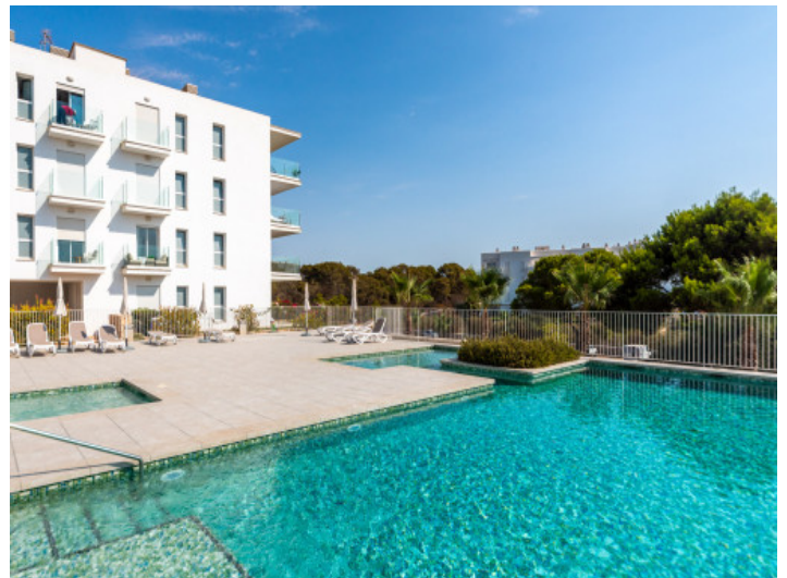
Fassade und Gemeinschaftspool