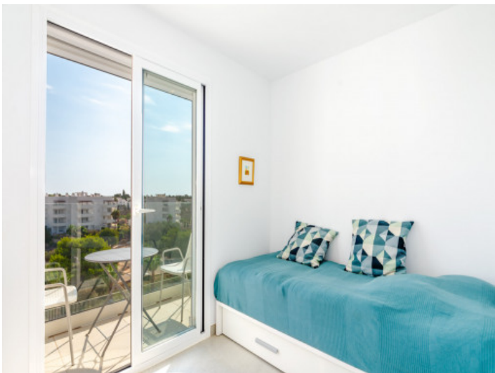
Das 2. Schlafzimmer