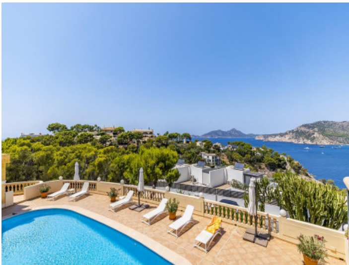
Blick über den Poolbereich aufs Meer

Alle Angaben nach bestem Wissen. Irrtum und Zwischenverkauf vorbehalten. Dieses Exposé ist eine Vorinformation, als Rechtsgrundlage gilt allein der notariell abgeschlossene Kaufvertrag.