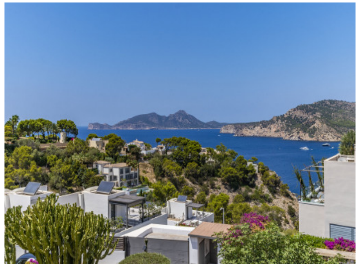
Blick aufs Meer und Dragonera