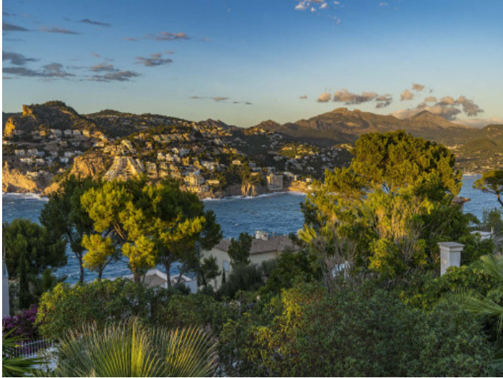
Blick auf Port Andratx