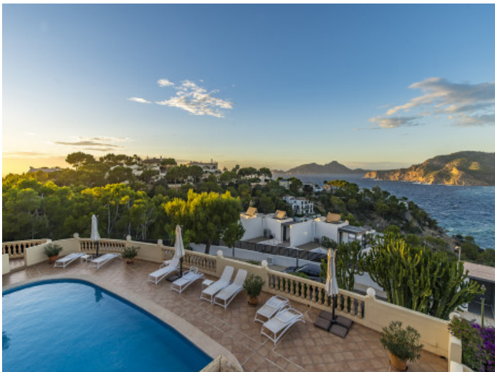
Blick über den Pool am Abend