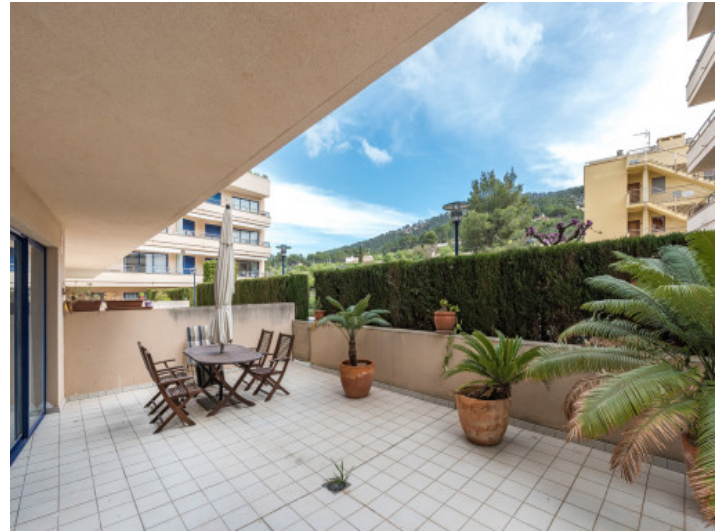
Große Terrasse mit Essbereich