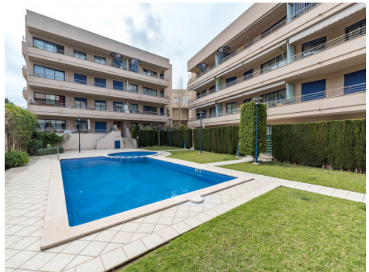
Die Wohnung ist ideal für eine Familie