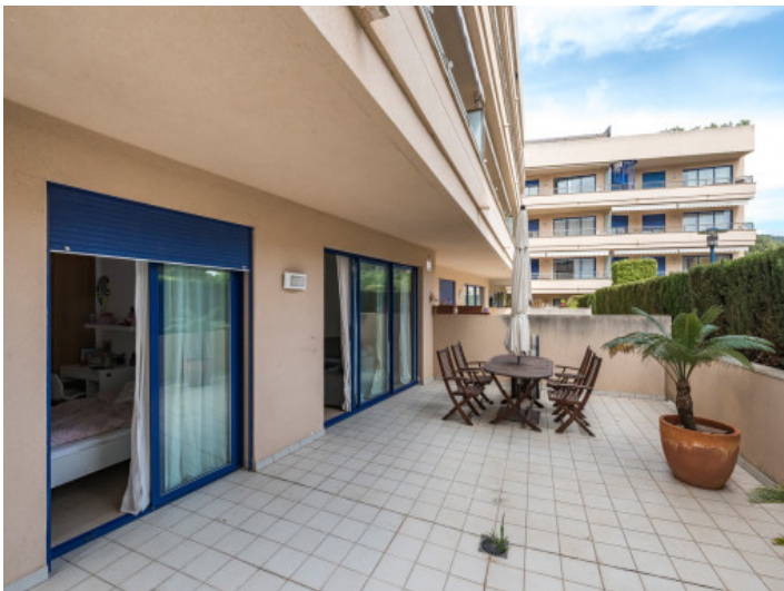
Private und teilweise überdachte Terrasse