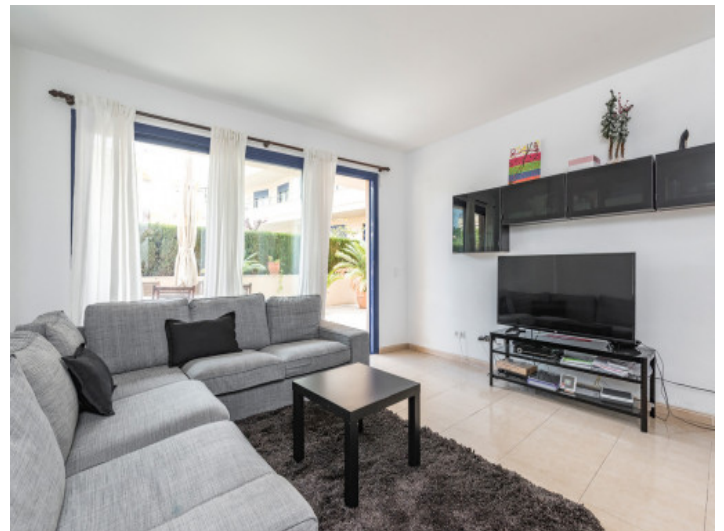
Komfortabler Wohnbereich mit Terrassenzugang