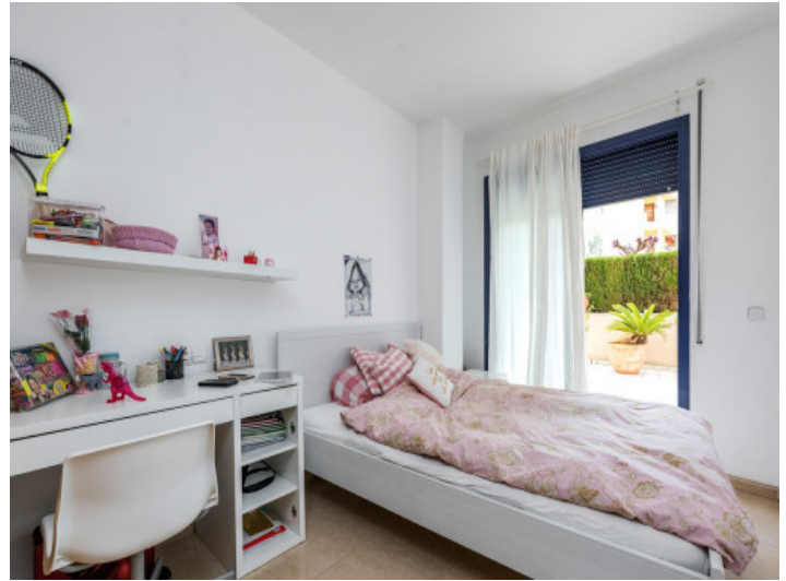
Tolles Schlafzimmer mit Terrassenzugang