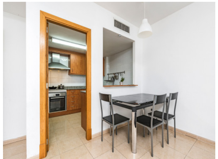
Durchreiche zwischen Küche und Essbereich

Alle Angaben nach bestem Wissen. Irrtum und Zwischenverkauf vorbehalten. Dieses Exposé ist eine Vorinformation, als Rechtsgrundlage gilt allein der notariell abgeschlossene Kaufvertrag.