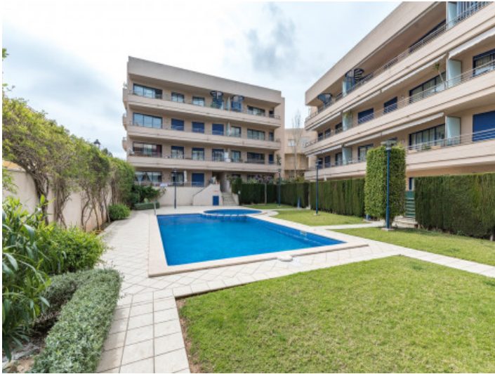
Die Wohnung befindet sich in einer gepflegten Wohnanlage