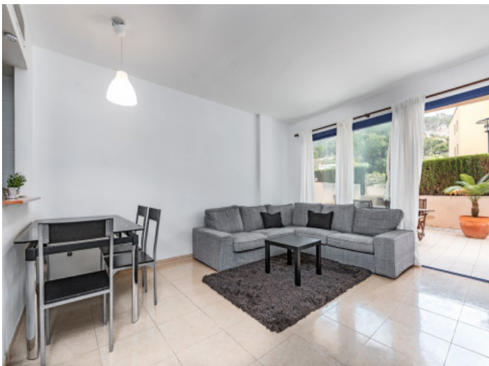
Schöner Wohn- und Essbereich