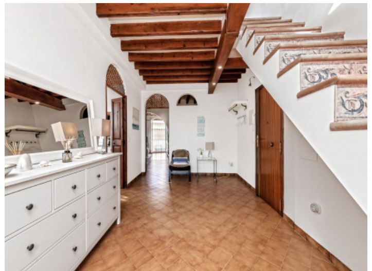
Treppenaufgang zum Loungebereich

Alle Angaben nach bestem Wissen. Irrtum und Zwischenverkauf vorbehalten. Dieses Exposé ist eine Vorinformation, als Rechtsgrundlage gilt allein der notariell abgeschlossene Kaufvertrag.