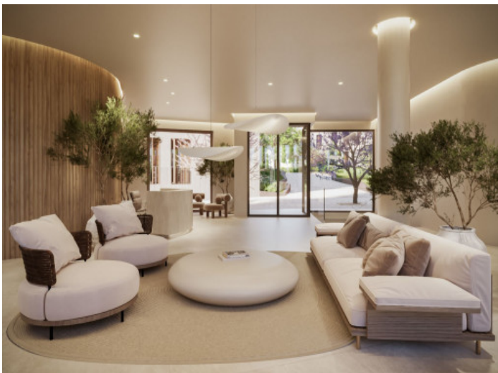
Empfangsbereich des Gebäudes