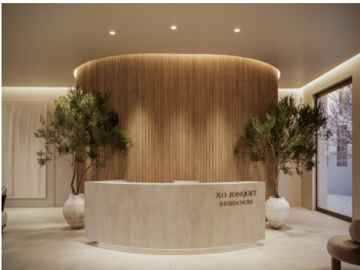
Eingangsbereich der Rezeption