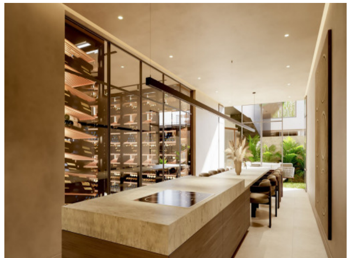
SPA und Innenpool

Alle Angaben nach bestem Wissen. Irrtum und Zwischenverkauf vorbehalten. Dieses Exposé ist eine Vorinformation, als Rechtsgrundlage gilt allein der notariell abgeschlossene Kaufvertrag.