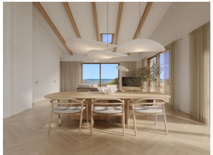
Eingangsbereich der Rezeption

Alle Angaben nach bestem Wissen. Irrtum und Zwischenverkauf vorbehalten. Dieses Exposé ist eine Vorinformation, als Rechtsgrundlage gilt allein der notariell abgeschlossene Kaufvertrag.