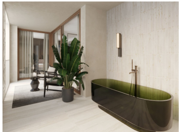
Eins von 4 Badezimmer

Alle Angaben nach bestem Wissen. Irrtum und Zwischenverkauf vorbehalten. Dieses Exposé ist eine Vorinformation, als Rechtsgrundlage gilt allein der notariell abgeschlossene Kaufvertrag.