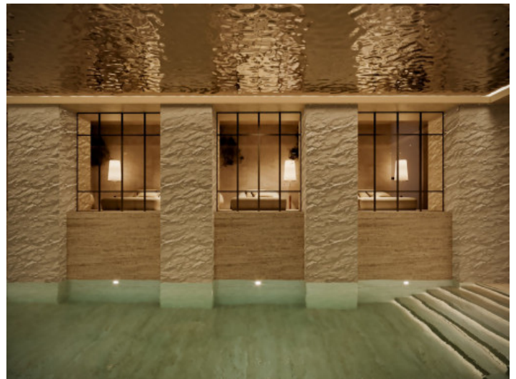
SPA und Innenpool