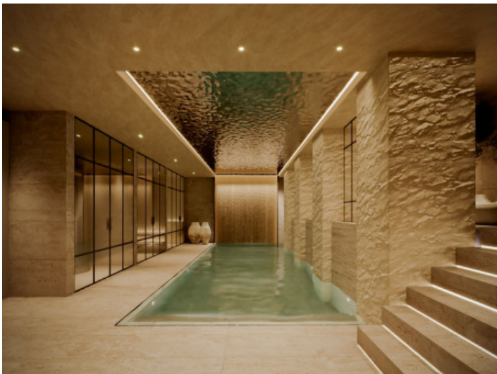
SPA und Innenpool