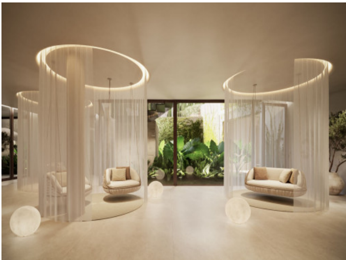
Rezeption im Spa-Bereich