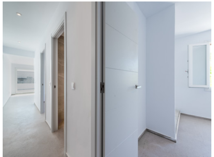
Einblick in die Wohnung