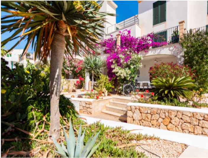
Ansicht auf das Objekt