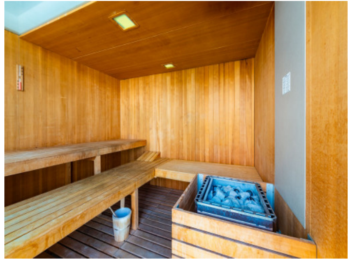
Sauna im Gebäude