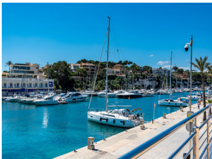
Yachthafen von Porto Cristo