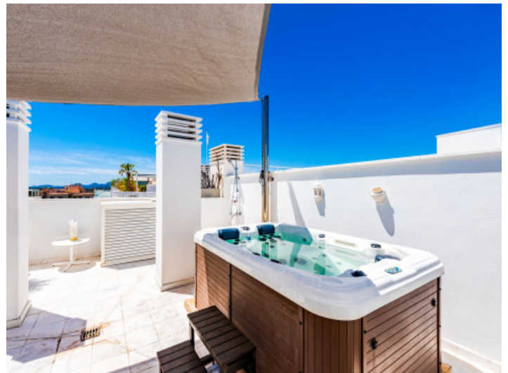
Jacuzzi auf der privaten Dachterrasse