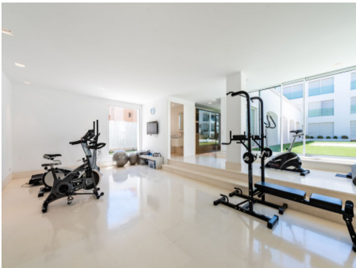
Fitnessraum im Gemeinschaftsbereich