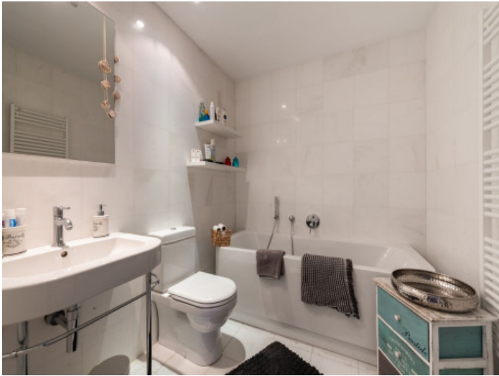
Ein weiteres Badezimmer