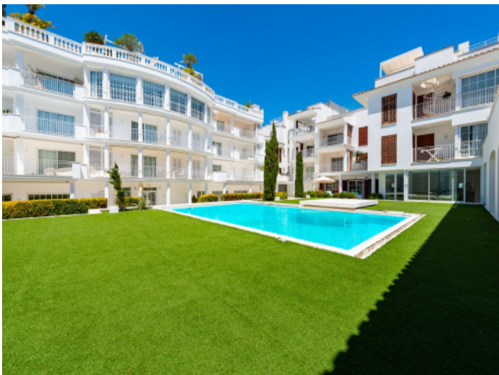
Sehr gepflegte Aussenanlagen