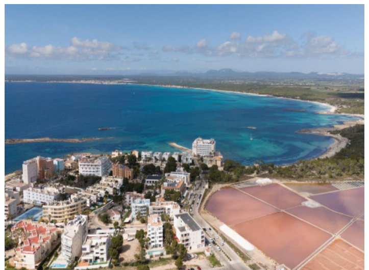
Colonia Sant Jordi und der Strand

Alle Angaben nach bestem Wissen. Irrtum und Zwischenverkauf vorbehalten. Dieses Exposé ist eine Vorinformation, als Rechtsgrundlage gilt allein der notariell abgeschlossene Kaufvertrag.