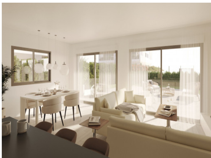
Wohn- und Essbereich