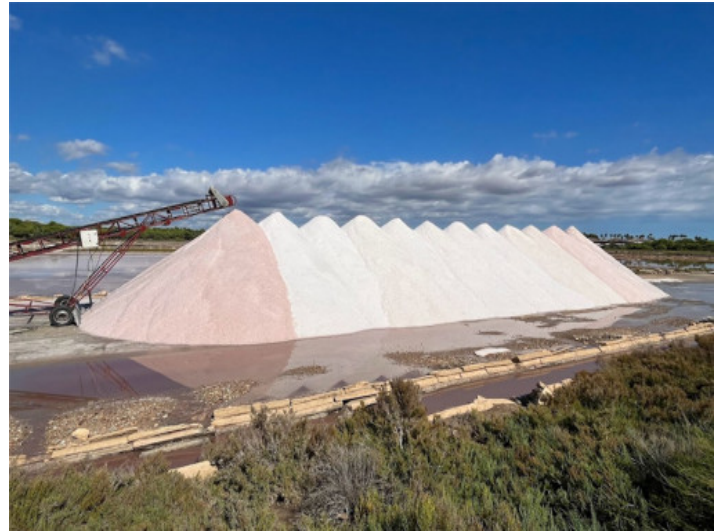
Salinen von Es Trenc