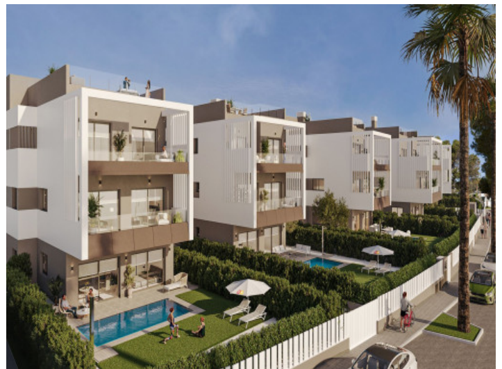
Ansicht auf die Anlage

Alle Angaben nach bestem Wissen. Irrtum und Zwischenverkauf vorbehalten. Dieses Exposé ist eine Vorinformation, als Rechtsgrundlage gilt allein der notariell abgeschlossene Kaufvertrag.