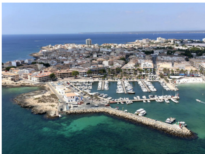
Hafen von Colonia Sant Jordi