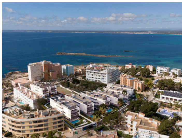
Colonia Sant Jordi