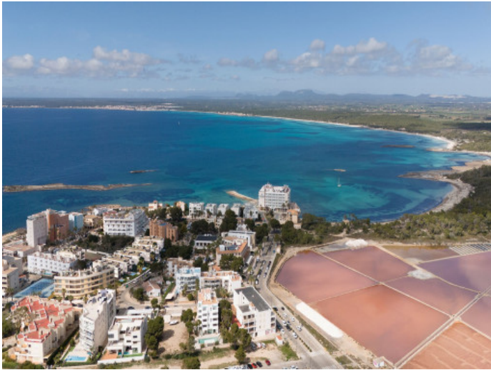
Colonia Sant Jordi und der Strand