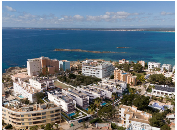
Colonia Sant Jordi