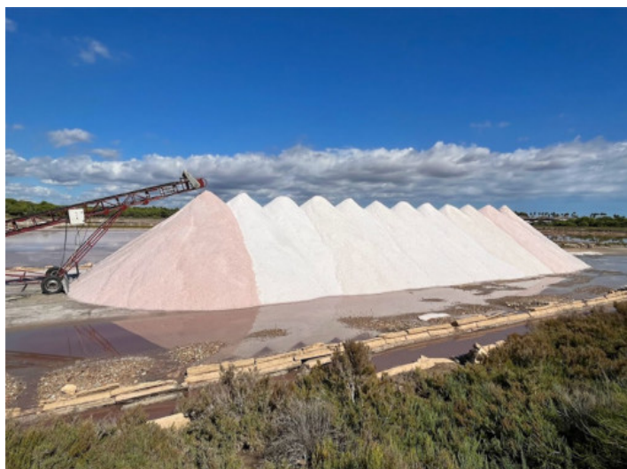
Salinen von Es Trenc