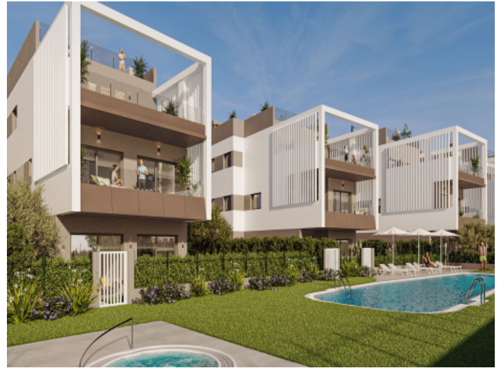
Fassade und Gemeinschaftspool