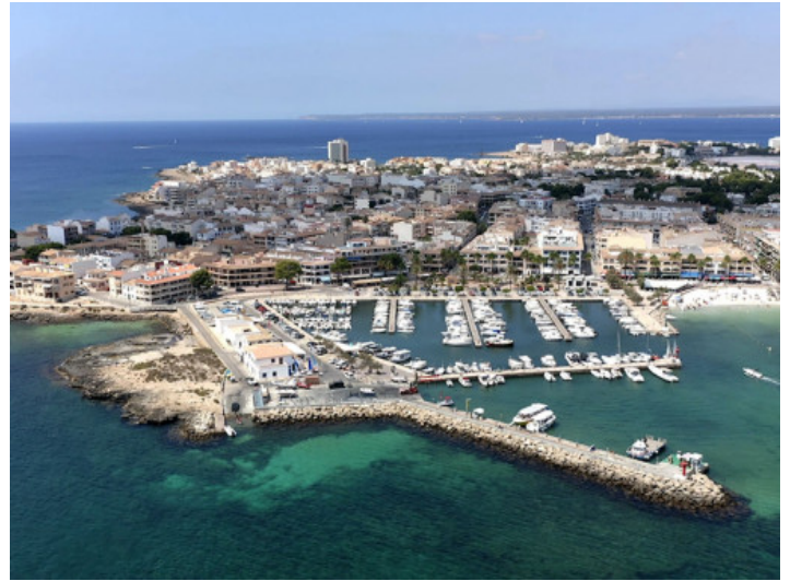
Hafen von Colonia Sant Jordi