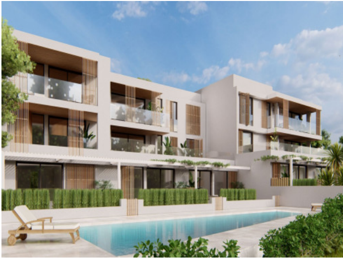
Ansicht auf die Anlage