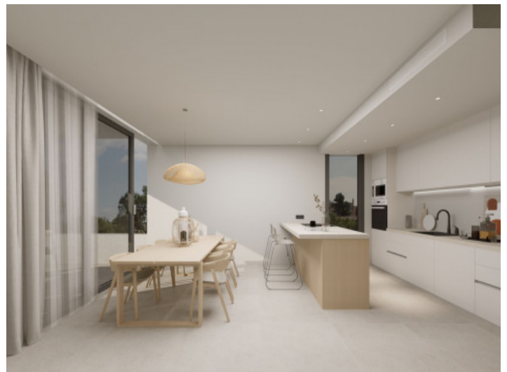
Offene Küche und Essbereich

Alle Angaben nach bestem Wissen. Irrtum und Zwischenverkauf vorbehalten. Dieses Exposé ist eine Vorinformation, als Rechtsgrundlage gilt allein der notariell abgeschlossene Kaufvertrag.