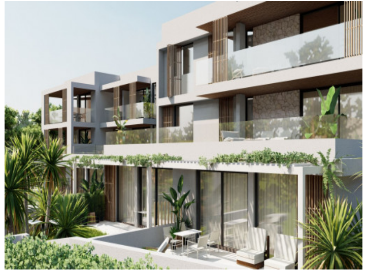
Blick auf eine Wohnung im Erdgeschoss