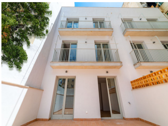
Ansicht des Gebäudes