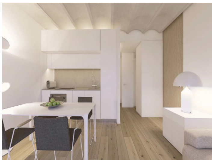
Essbereich und Küche