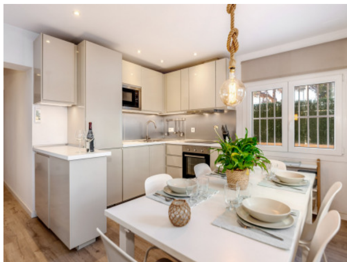
Essbereich und Küche

Alle Angaben nach bestem Wissen. Irrtum und Zwischenverkauf vorbehalten. Dieses Exposé ist eine Vorinformation, als Rechtsgrundlage gilt allein der notariell abgeschlossene Kaufvertrag.