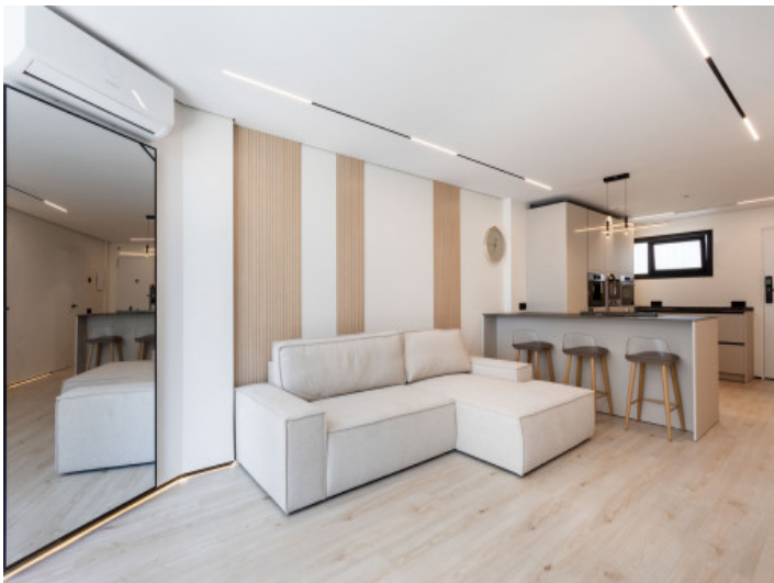
Offener Wohn und Essbereich