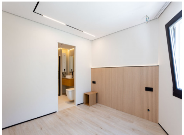
Hauptschlafzimmer mit Badezimmer en Suite

Alle Angaben nach bestem Wissen. Irrtum und Zwischenverkauf vorbehalten. Dieses Exposé ist eine Vorinformation, als Rechtsgrundlage gilt allein der notariell abgeschlossene Kaufvertrag.