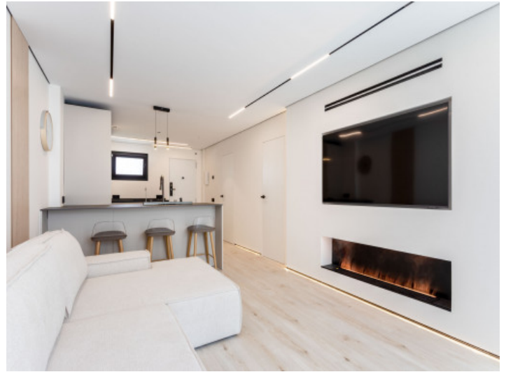
Wohnbereich mit Kamin