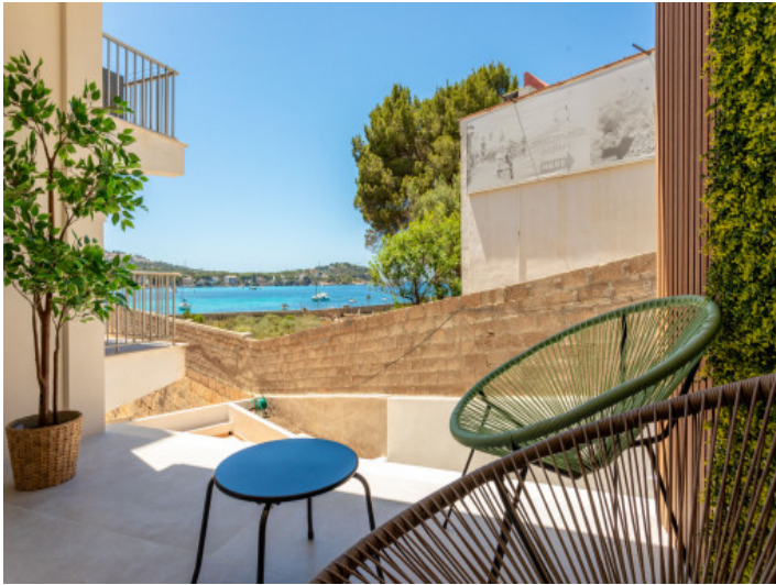
Terrasse mit Meerblick