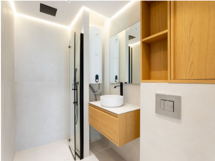
Badezimmer en Suite