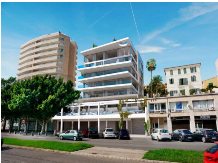
Ansicht des Gebäudes