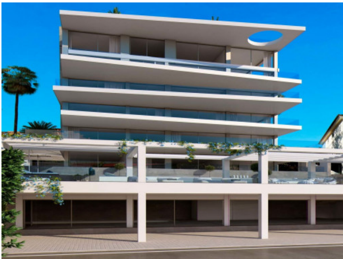
Ansicht auf die Fassade