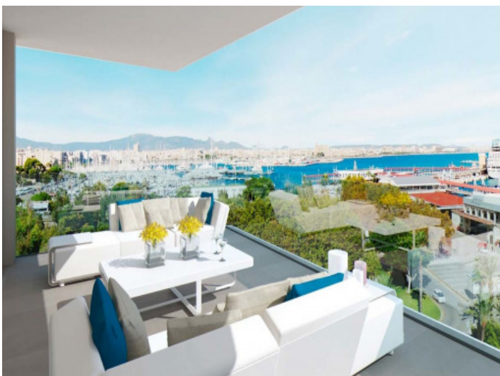
Aussicht auf den Hafen über die Stadt bishin zur Kathedrale