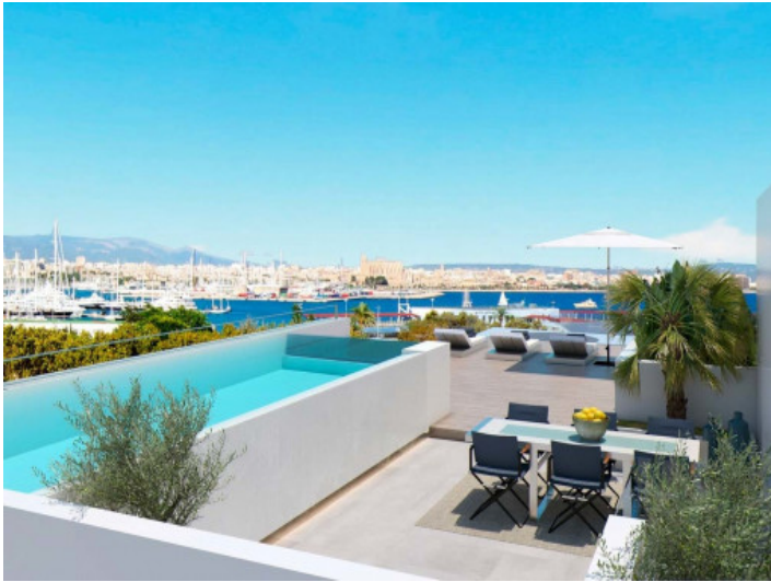
Penthouse mit privatem Pool