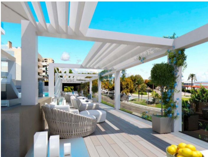
Teils überdachte Terrassen