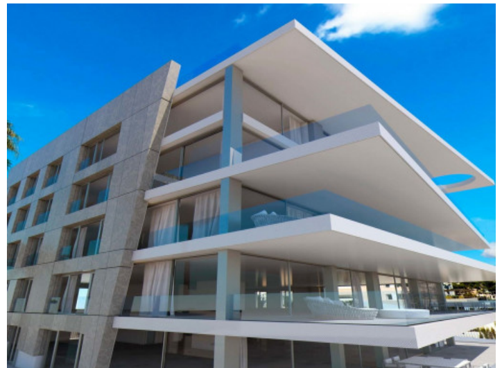
Insgesamt gibt es 15 Apartments