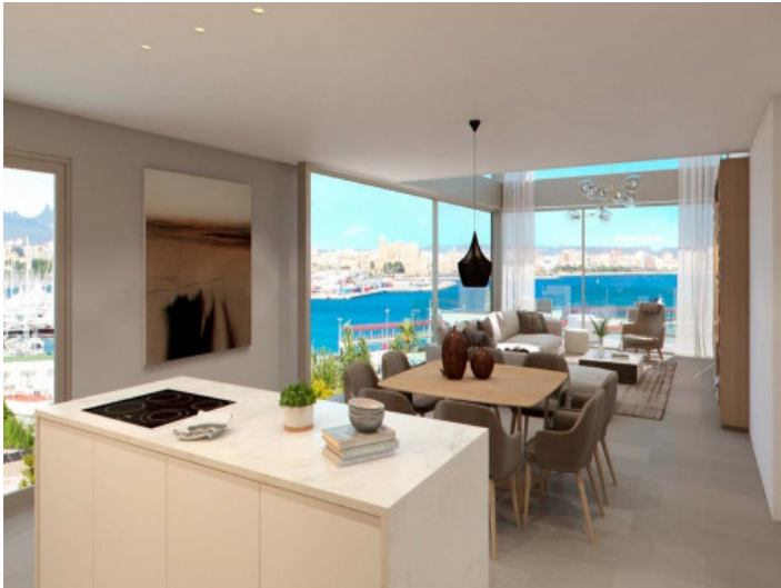
Offene Küche mit Essbereich