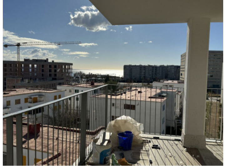
Terrasse und Meerblick