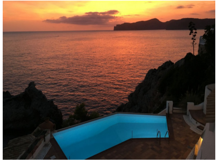
Beleuchteter Gemeinschaftspool mit Meerblick