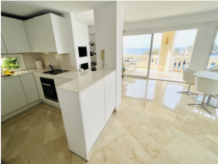
Lichtdurchfluteter Wohnbereich mit offener, moderner Küche