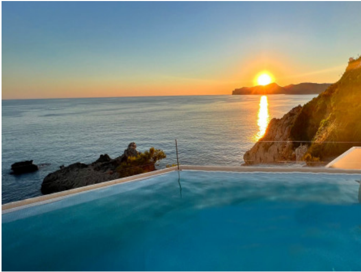
Gemeinschaftspool mit atemberaubendem Ausblick