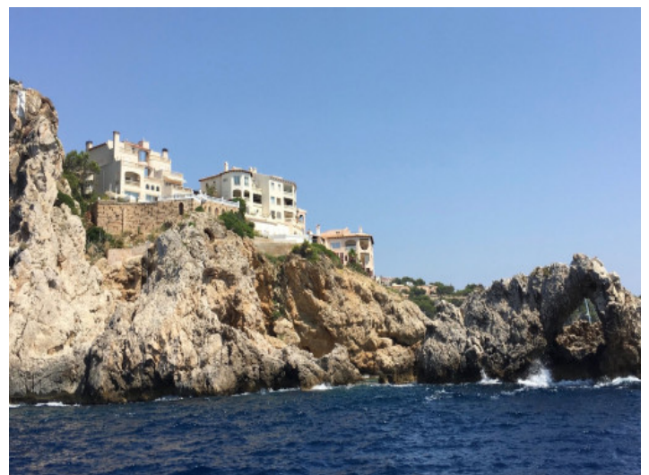
Außenansicht vom Meer

Alle Angaben nach bestem Wissen. Irrtum und Zwischenverkauf vorbehalten. Dieses Exposé ist eine Vorinformation, als Rechtsgrundlage gilt allein der notariell abgeschlossene Kaufvertrag.