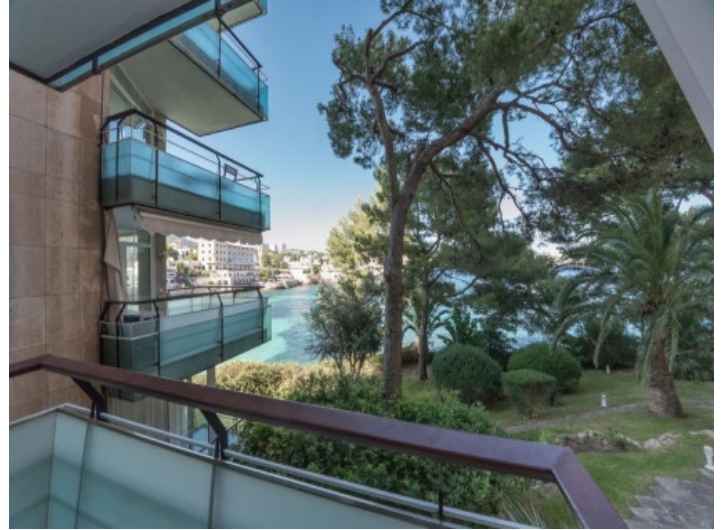
Herrlicher Meerblick vom Balkon aus