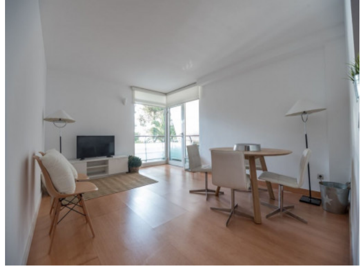
Lichtdurchfluteter Wohn- und Essbereich