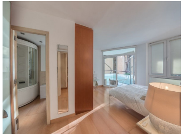
Das Schlafzimmer verfügt über ein Badezimmer en Suite