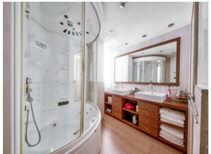
Wundervolles Badezimmer mit Badewanne

Alle Angaben nach bestem Wissen. Irrtum und Zwischenverkauf vorbehalten. Dieses Exposé ist eine Vorinformation, als Rechtsgrundlage gilt allein der notariell abgeschlossene Kaufvertrag.