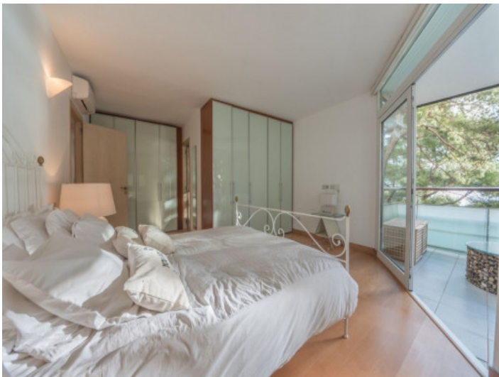
Charmantes Schlafzimmer mit Zugang zum Balkon