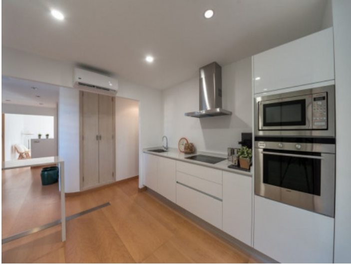
Voll ausgestattete, moderne Küche