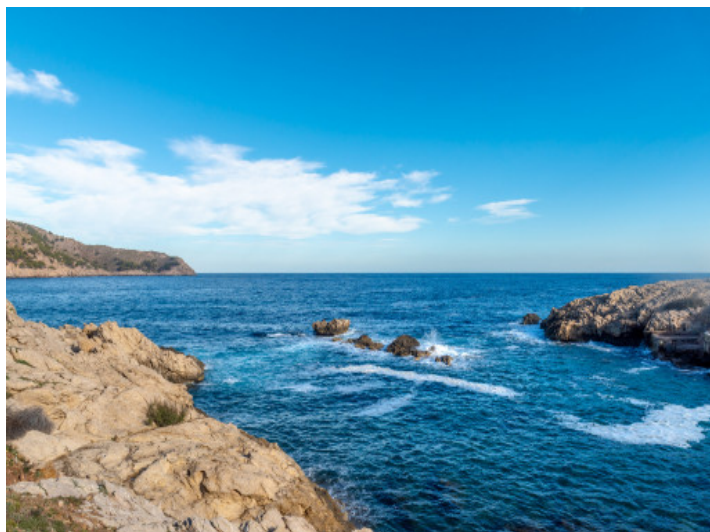
Atemberaubende Lage in erster Meereslinie