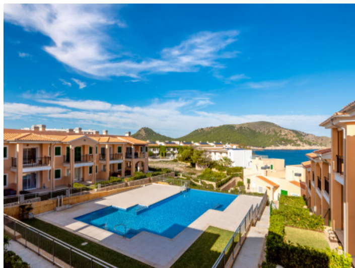
Herrlicher Komplex mit Gemeinschaftspool