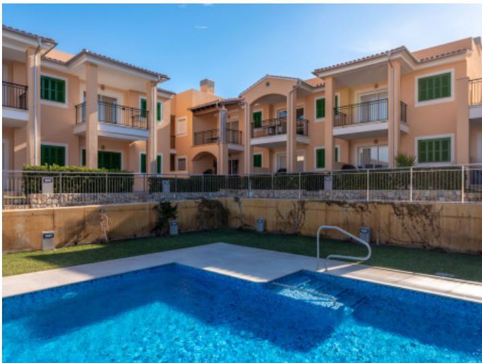
Anischt der Anlage und Pool