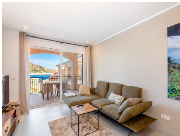
Wohnbereich mit Poolzugang