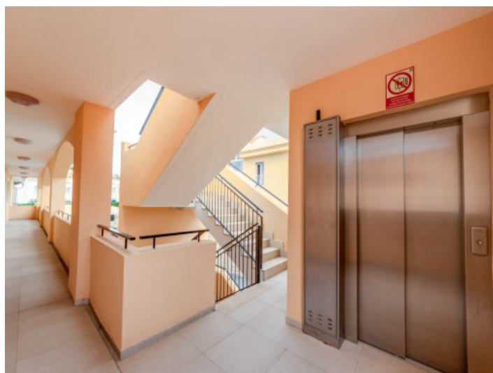
Aufzug in der Anlage