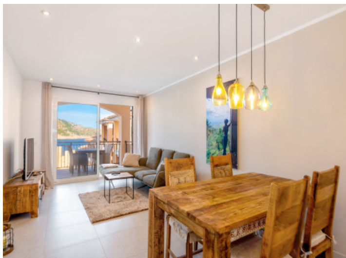
Schöner Wohn-und Essbereich