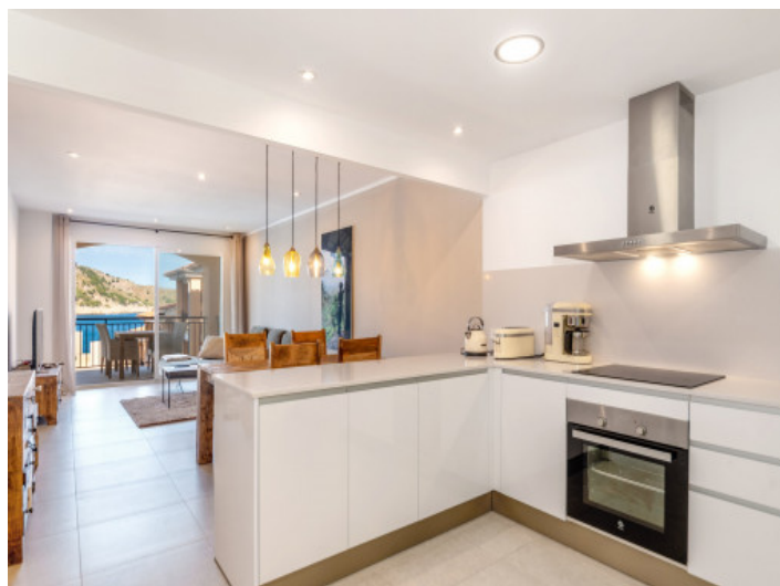
Offene, moderne Küche

Alle Angaben nach bestem Wissen. Irrtum und Zwischenverkauf vorbehalten. Dieses Exposé ist eine Vorinformation, als Rechtsgrundlage gilt allein der notariell abgeschlossene Kaufvertrag.