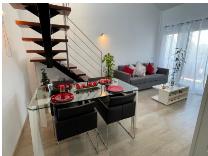
Wohn-/Essbereich mit direktem Balkonzugang