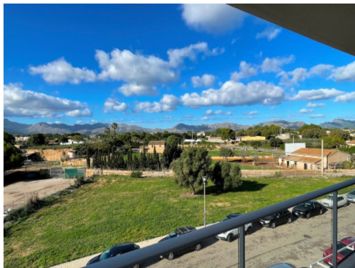
Schöner Weitblick bis zu den Bergen