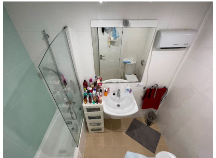
Eines von 2 Badezimmern