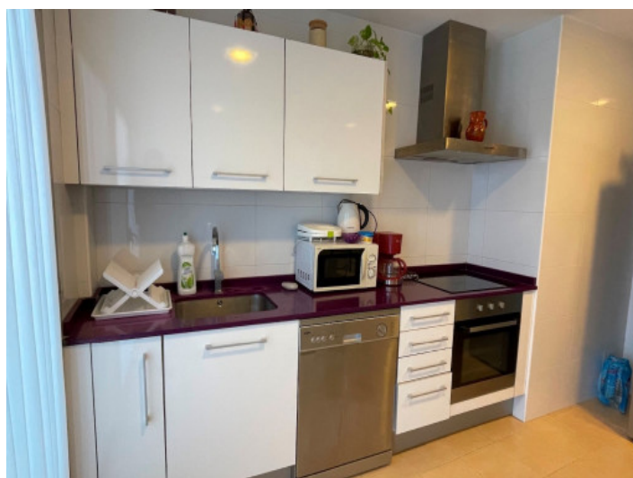
Voll ausgestattete Küche

Alle Angaben nach bestem Wissen. Irrtum und Zwischenverkauf vorbehalten. Dieses Exposé ist eine Vorinformation, als Rechtsgrundlage gilt allein der notariell abgeschlossene Kaufvertrag.