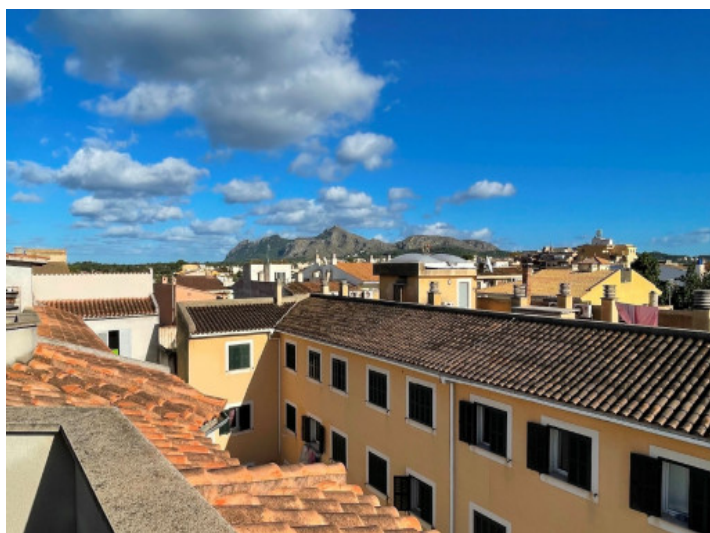
Blick von der Dachterrasse