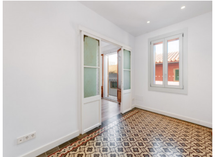
Eins von zwei Schlafzimmer