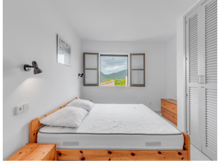
Meerblick vom Schlafzimmer aus