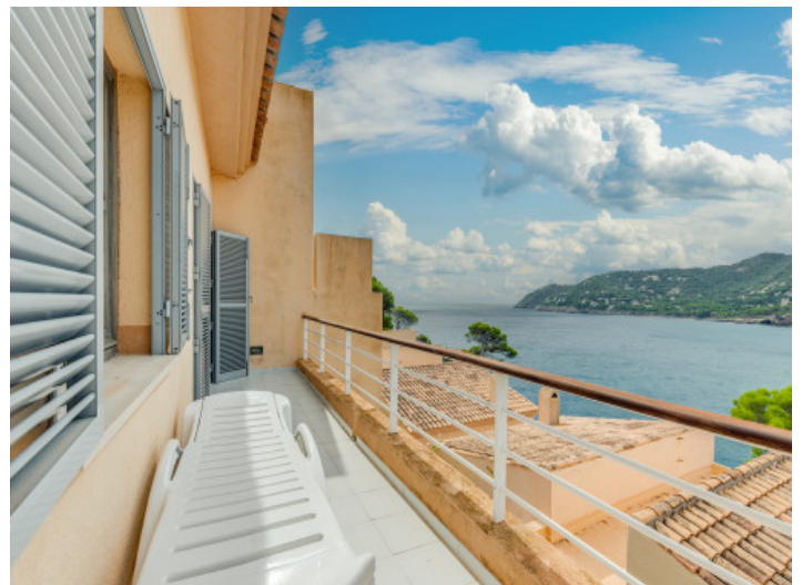
Blick vom Balkon in die Umgebung

Alle Angaben nach bestem Wissen. Irrtum und Zwischenverkauf vorbehalten. Dieses Exposé ist eine Vorinformation, als Rechtsgrundlage gilt allein der notariell abgeschlossene Kaufvertrag.