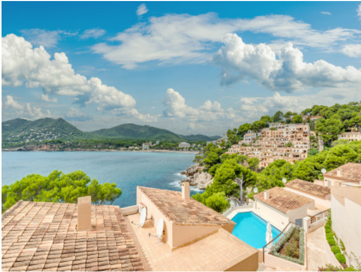
Blick in die Nachbarschaft