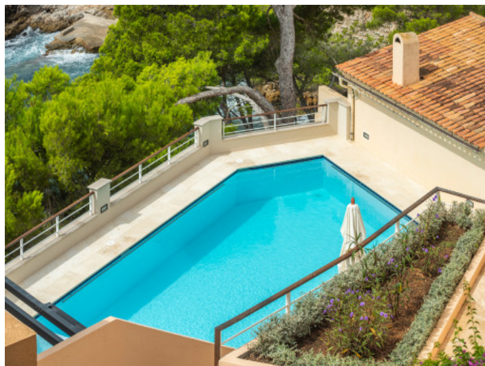
Blick auf den Pool vom Balkon