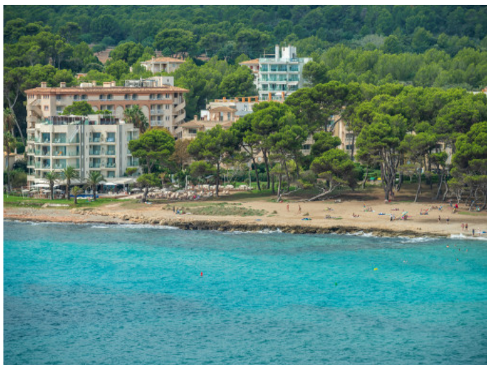
Blick auf den Strand vom Balkon