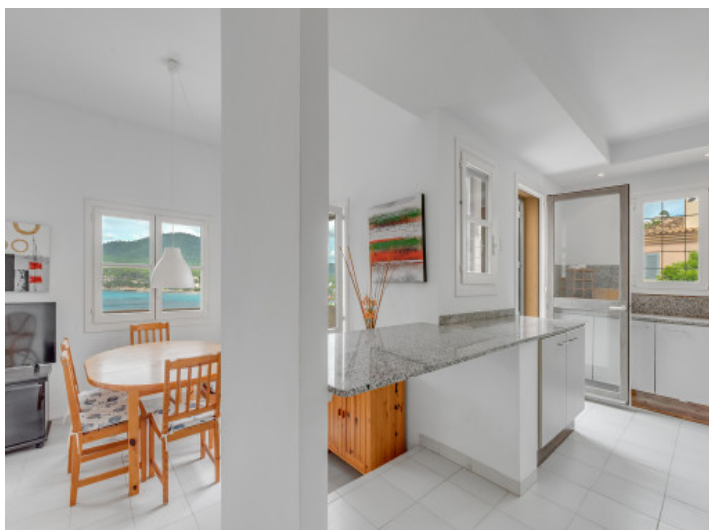
Blick von der Küche in den Essbereich