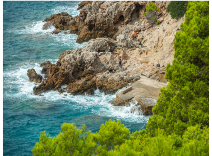
Blick zur Steilküste

Alle Angaben nach bestem Wissen. Irrtum und Zwischenverkauf vorbehalten. Dieses Exposé ist eine Vorinformation, als Rechtsgrundlage gilt allein der notariell abgeschlossene Kaufvertrag.