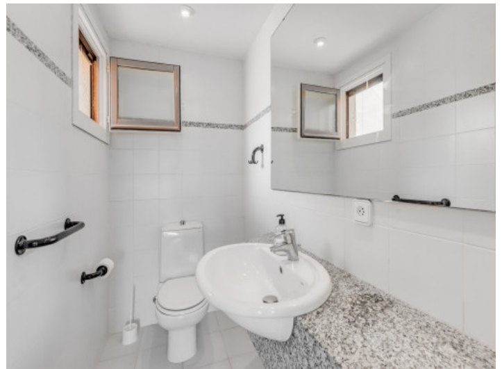
Badezimmer mit Tageslicht