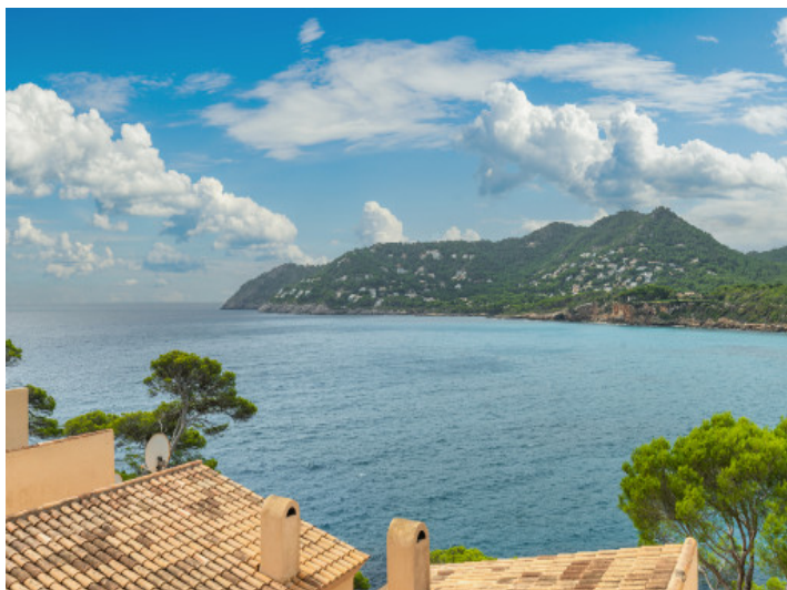
Blick auf das Mittelmeer vom Balkon