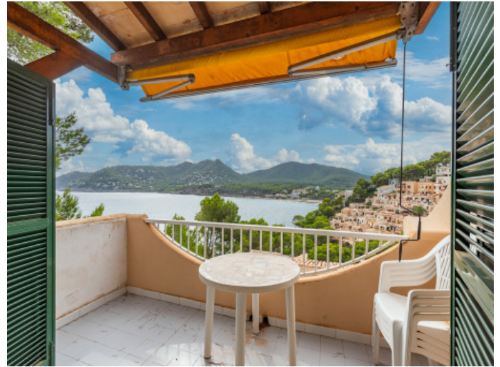
Balkon mit Blick auf das Mittelmeer