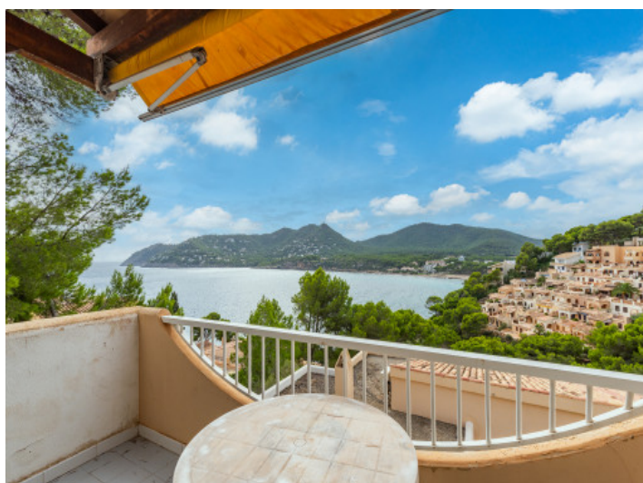
Blick vom Balkon zu den Bergen