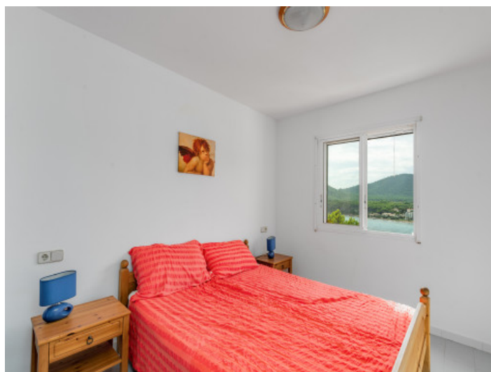
Schlafzimmer mit Meerblick