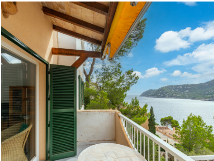
Balkon mit Markise