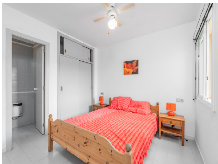
Schlafzimmer mit Badezimmer en Suite