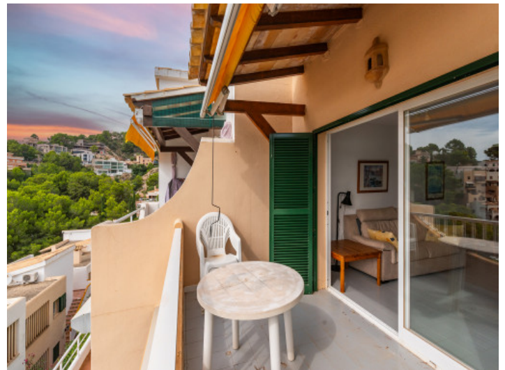
Blick in die Umgebung vom Balkon aus